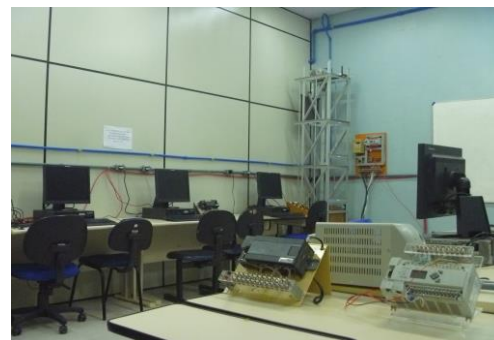
Vista geral do laboratório