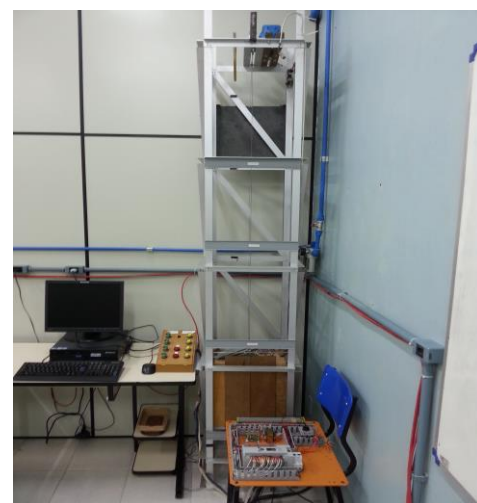
Planta didática de um elevador