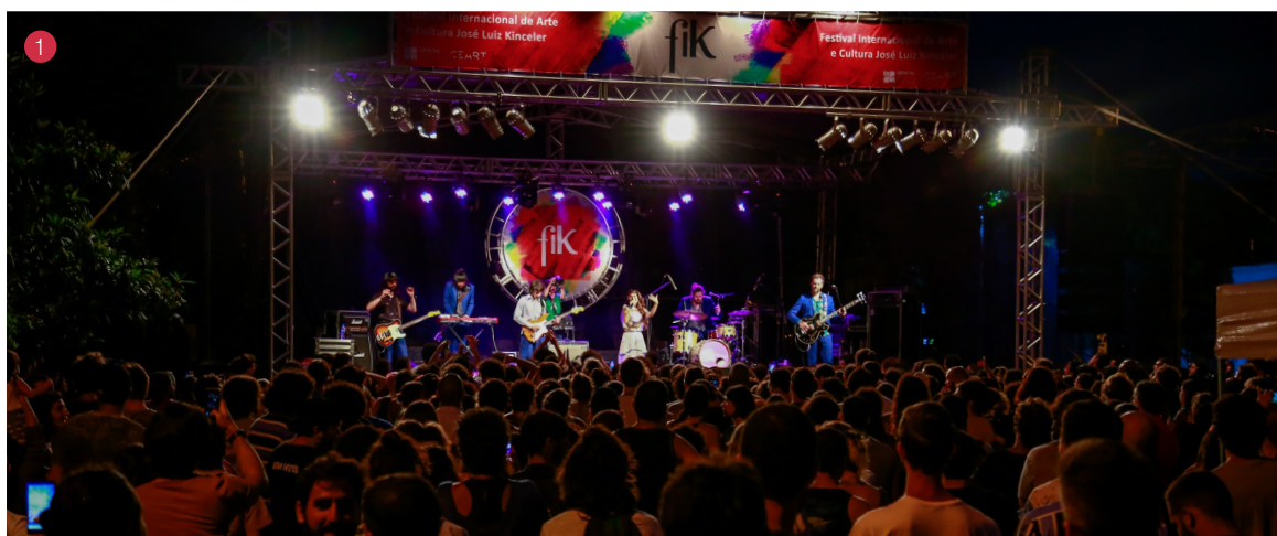
1) Show com a Banda Mais Bonita da Cidade

O Festival Internacional de Arte e Cultura José Luiz Kinceler - FIK 2018 movimentou a Universidade do Estado de Santa Catarina (Udesc) no mês de fevereiro. A programação teve início no dia 4, com a cerimônia de abertura, e terminou no, dia 7, com a apresentação da Banda Cores de Aidê e do grupo União da Ilha da Magia Samba Show.