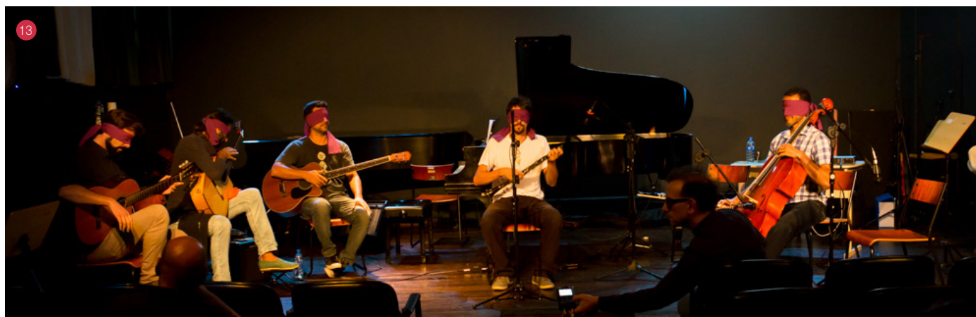
2) Oficina Artesanato em Fibras - Foto: Soninha Vill | 3) Piquenique Ético-Estético - Foto: Eduardo Beltrame | 4) Oficina Qual é o seu Cenário?- Foto: Eduardo Beltrame | 5) Oficina Arte Urbana - Medianeras Murales - Foto: Eduardo Beltrame | 6) Quedelhe o Boi - Foto: Eduardo Beltrame | 7) Seminário Walter Benjamin - Foto: Eduardo Beltrame | 8) Boi de Mamão - Foto: Soninha Vill | 9) Feira das Rendeiras de Florianópolis - Foto: Eduardo Beltrame | 10) Oficina Residência Artística e Oficinas de Cerâmica - Foto: Eduardo Beltrame | 11) Apresentação teatral Guerreiras Donzelas - Foto: Soninha Vill | 12) Parque Gráfico - Foto: Eduardo Beltrame | 13) Concerto GMEC - Foto: Soninha Vill