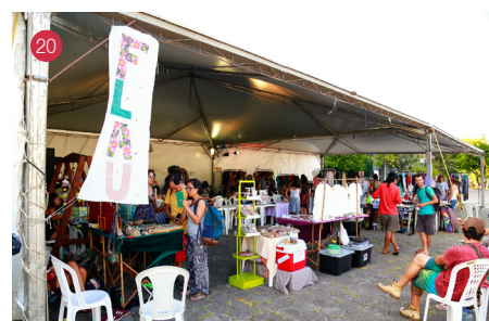
14) Apresentação teatral Bela - Foto: Eduardo Beltrame | 15) Oficina Composição de Músicas para Crianças - Foto: Eduardo Beltrame | 16) Apresentação teatral Mujeres Violentas - Foto: Eduardo Beltrame | 17) Exposição VerAcidade - Foto: Eduardo Beltrame | 18) Banda Cores de Aidê - Foto: Eduardo Beltrame | 19) Oficina Aquarela - Foto: Eduardo Beltrame | 20) FLAU - Foto: Eduardo Beltrame