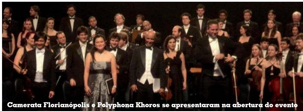
Camerata Florianópolis e Polyphona Khoros se apresentaram na abertura do evento

Durante cinco dias a capital, Florianópolis, e mais 16 cidades catarinenses foram inundadas por um mar de cultura e arte na área de teatro, cinema, dança, música, multimídia, artes plásticas, além de exposições de moda, desenho, arquitetura e artesanato, oficinas, ações educativas e palestras, tudo gratuito e aberto ao público.