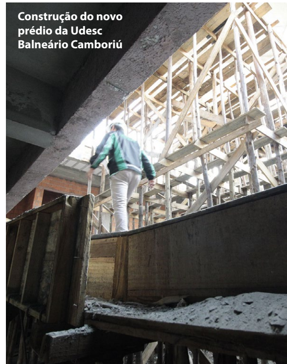
Construção do novo prédio da Udesc Balneário Camboriú