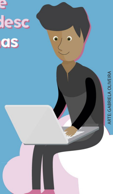
ARTE: GABRIELA OLIVEIRA

Sai Expresso, entra Office 365: plataforma atual apresenta limitações no acesso via celulares e tablets. Por meio do Office 365, será possível acessar a internet de qualquer dispositivo móvel