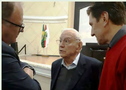
O fundador da Embraer, Ozires Silva, fez palestra especial na Udesc Planalto Norte, em São Bento do Sul