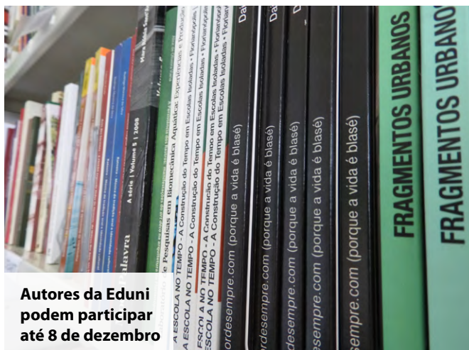
Autores da Eduni podem participar até 8 de dezembro