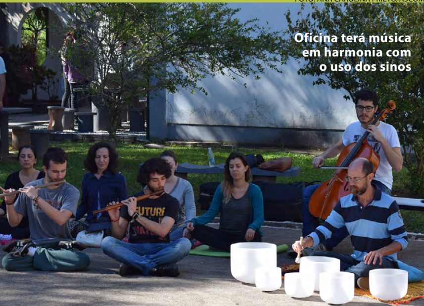
Oficina terá música em harmonia com o uso dos sinos