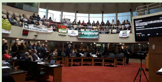
Mais de cem técnicos e professores da Udesc se mobilizaram para acompanhar as votações