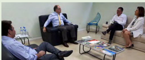
Tomasi e Zvirtes receberam nesta semana a visita de pró-reitores da Universidade do Minho, de Portugal, para tratar de parcerias em várias áreas com a Udesc.