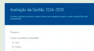
Pesquisa de avaliação da gestão: bit.ly/AvaliacaoGestao201620Udesc

Entrevista do reitor à Rádio Udesc FM Florianópolis bit.ly/EntrevistaReitorUdesc120418