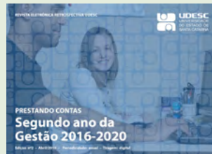
Revista Eletrônica Retrospectiva Udesc nº 02 bit.ly/RetrospectivaUdesc02