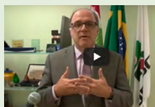
Vídeo de balanço bit.ly/VideoBalanço2anosGestaoUdesc