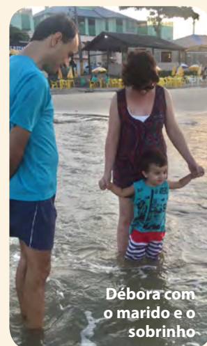
Débora com o marido e o sobrinho