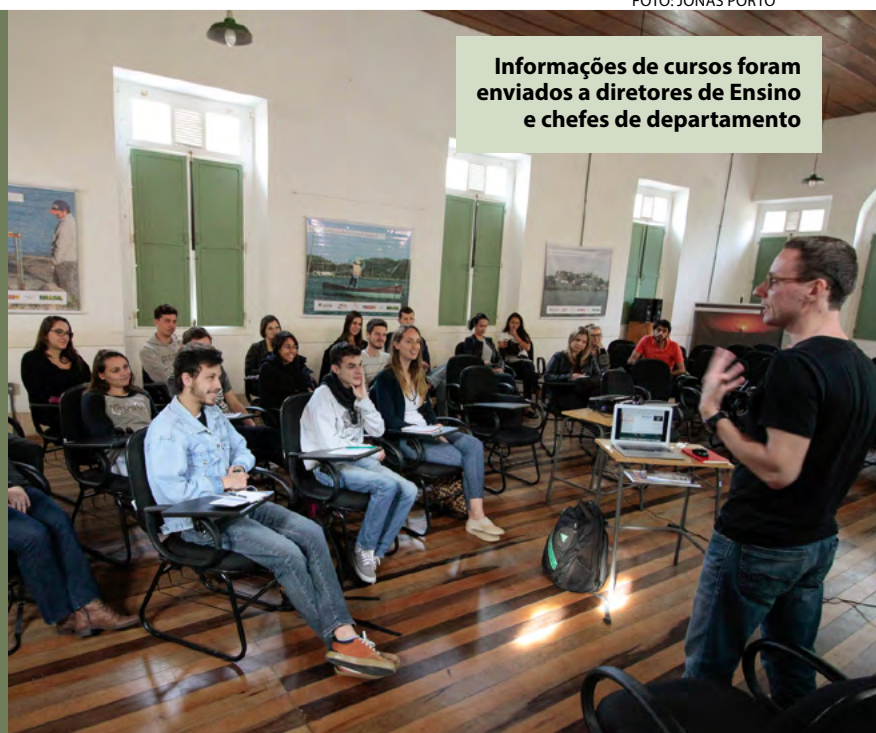
Informações de cursos foram enviados a diretores de Ensino e chefes de departamento

◆ A Pró-Reitoria de Ensino (Proen) e a Coordenadoria de Avaliação Institucional (Coai), da Udesc, realizaram um mapeamento pedagógico dos cursos de graduação. A iniciativa visa proporcionar o acompanhamento dos indicadores de qualidade definidos pelos processos avaliativos internos e externos da universidade. Os documentos foram encaminhados aos diretores de Ensino de Graduação de todas as unidades e aos chefes de departamento de todos os cursos. Informações pelo e-mail proen.reitoria@udesc.br e pelo telefone (48) 3664-8124.