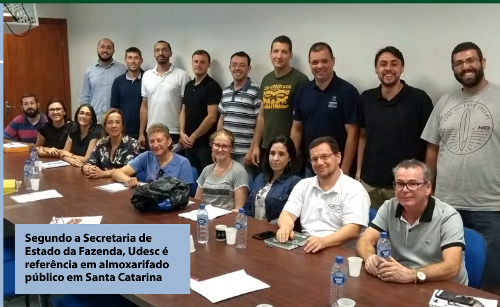
Segundo a Secretaria de Estado da Fazenda, Udesc é referência em almoxarifado público em Santa Catarina

Em abril, ocorreu a primeira reunião entre os responsáveis pelos 13 almoxarifados da Udesc e os servidores da Secretaria de Controle Interno (Seconti). Foram discutidas a atualização da instrução normativa que rege os almoxarifados da universidade, a necessidade de treinamento para técnicos desses setores e a revisão dos procedimentos para recebimento de materiais. Segundo a Diretoria de Auditoria Geral da Fazenda (Diag), a Udesc é referência em almoxarifado público no Estado.