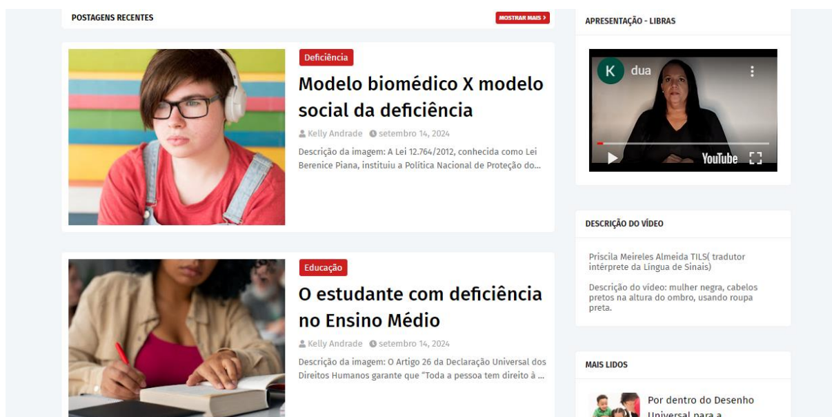
Imagem 4 - Catálogo de artigos do blog