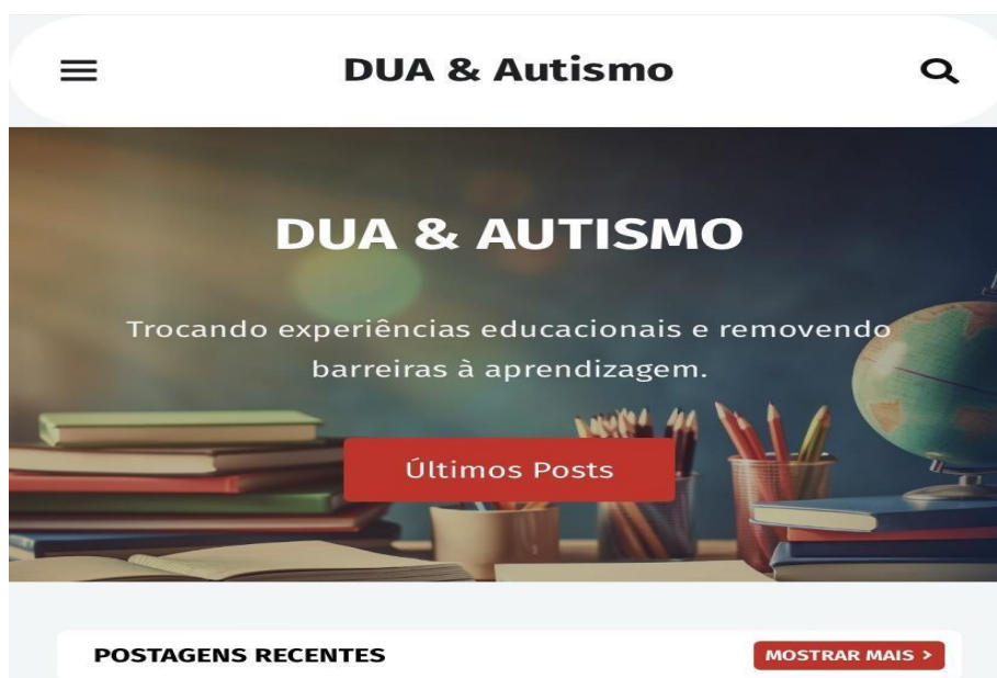
Imagem 3 - Tela inicial do blog