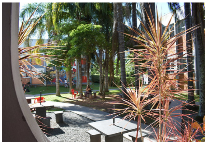
Uma das ações da DAD é a melhoria do espaço físico do Ceart.

Confira a matéria sobre os investimentos em apoio aos estudantes.