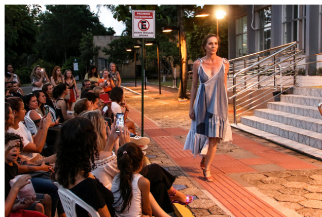
Evento Floripa Eco Fashion - Foto: Jerusa Mary