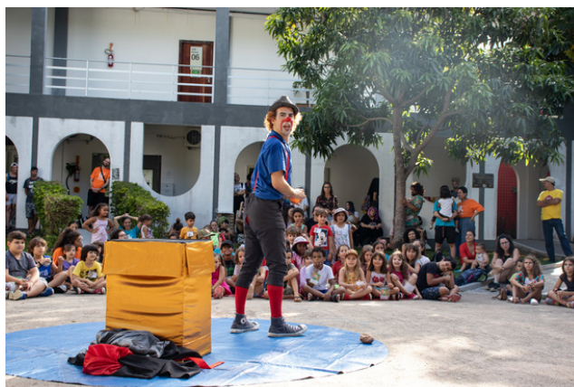
Apresentação "O Presente" no "Fik Criança"