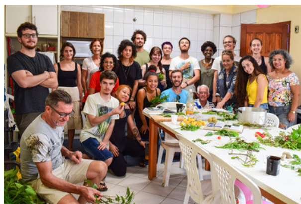
Ceart Aberto à Comunidade 2019: Agrobiodiversidade e PANC's.