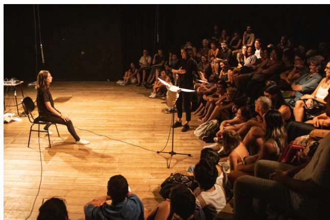
Apresentação "When vacas fly: ou quando as vacas voam"