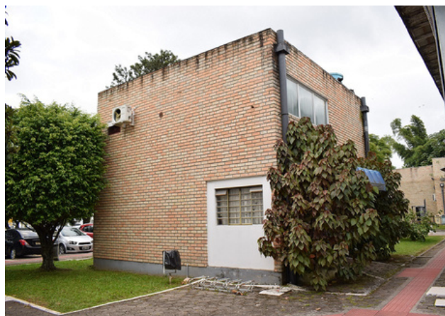
Laboratório de Fotografia: espaço contará com reforma.