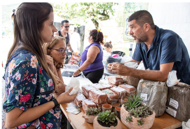
Feira Fik