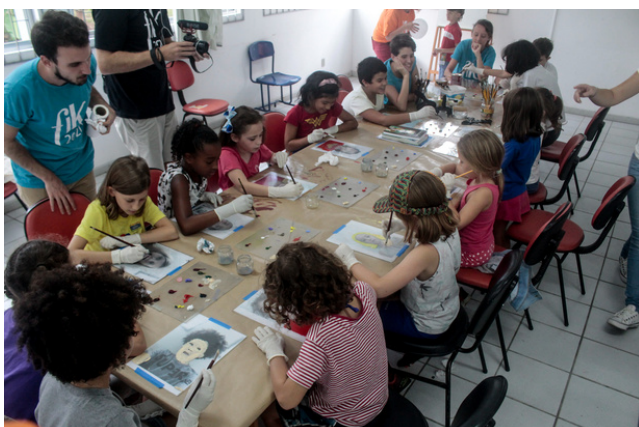
Fika Criança - Foto: Luna Cruz