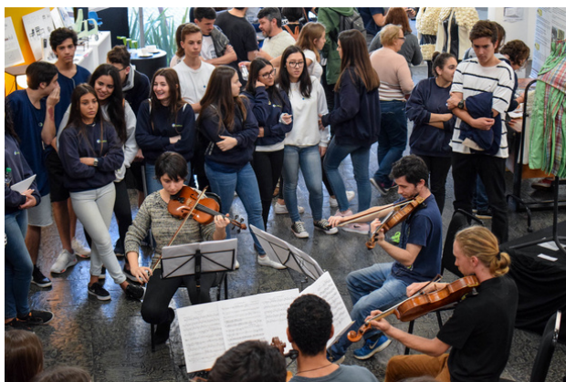
Parque das profissões 2018 - Foto: Laís Moser

O Ceart tem participado ativamente na divulgação dos seus cursos de graduação a partir do Parque das Profissões, evento organizado pela Udesc, criado para estudantes do Ensino Médio e de cursinhos pré-vestibulares que estão na fase da escolha do seu futuro profissional. No parque, os cursos de licenciatura e bacharelado organizam atividades práticas, concertos e organizam stands com produções artísticas e tecnológicas que permitam a interação com o público, contribuindo para a escolha do curso de graduação e para a formação e desempenho profissional.