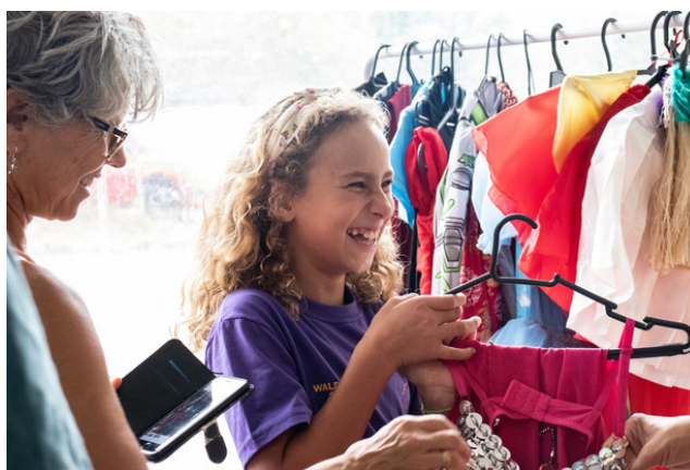
Feira Eco Moda