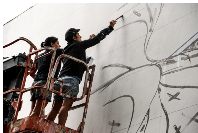
Mural Grafite