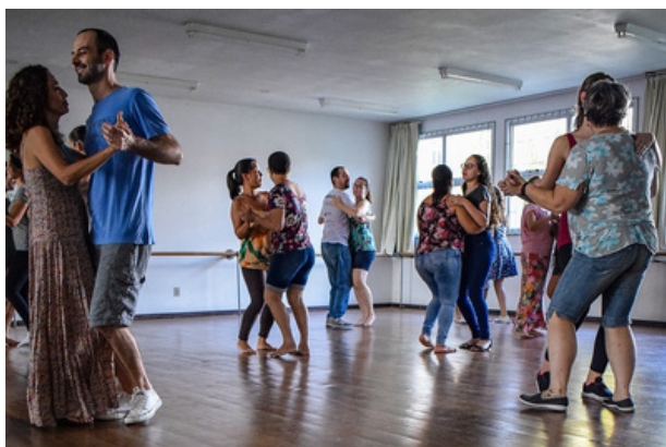
Ceart Aberto à Comunidade 2019: oficina de samba de gafeira.