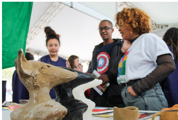
Parque das profissões 2019