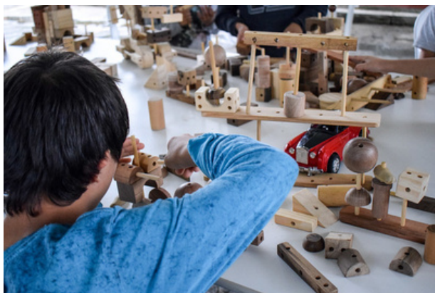
Ceart Aberto à Comunidade 2019: espaço criança com LIFE Udesc.