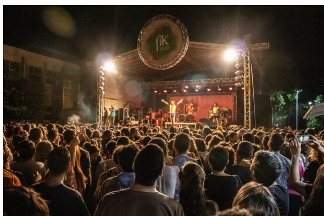
Show Rasgacabeza - Foto: Verônica Gazola

Em 2020 o FIK chegou à segunda edição e teve a participação de pelo menos 5 mil pessoas , entre jovens, adultos e crianças. Foram cinco dias de música, teatro, moda, artes visuais, por meio de oficinas, feiras, seminários, debates, rodas de conversa, shows, entre tantos outros. Totalizou mais de 150 atividades que aconteceram no Ceart e arredores: ao ar livre e nos espaços internos, socializando a cultura e a arte, fomentando a produção cultural de Florianópolis e região.