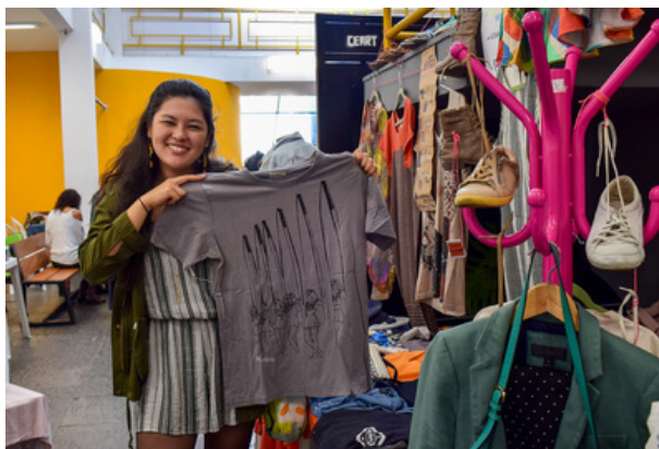
Ceart Aberto à Comunidade 2019: feira de arte, moda e artesanato.