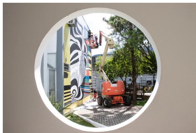
Mural coletivo com Medianeiras