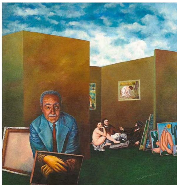
Marcio Sampaio. Déjeuner sur l'œuvre , 1977, pintura, acrílica sobre tela, 100 x 100 cm.

ignora. Agora, se Warburg é um historiador que procede também a cruzamentos, esses últimos não o mantêm no estrito interior da história da arte tradicional, já que ele transcende a disciplina pela abertura a um tipo de preocupação na qual é a dramaturgia da psique humana que está em jogo... Isso coloca sua obra, e nos coloca com ela, frente a desafios de pensamento que vão bem além da história da arte entendida em sentido tradicional.