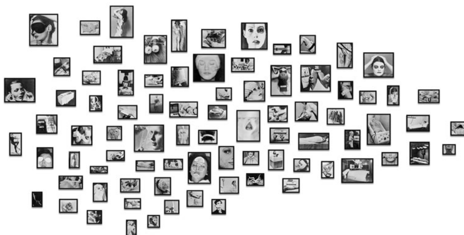
Annette Messager collectionneuse. Album collection n° 18. Les tortures volontaires , 1972, 200 x 40 cm.

funcionando como um museu no museu, essa instalação questiona a separação das disciplinas e encoraja uma interação do natural e do artificial no espírito aristotélico dos gabinetes de curiosidades. O espectador é mantido à distância das estantes [...] pelo meio de uma barreira de proteção que sugere a existência de uma barreira intelectual entre as diversas matérias universitárias 5 .