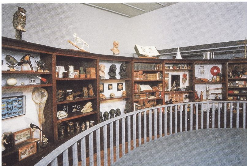
Mark Dion. Cabinet of Curiosities for the Wexner Center for the Arts , 1997. Columbus, Ohio.