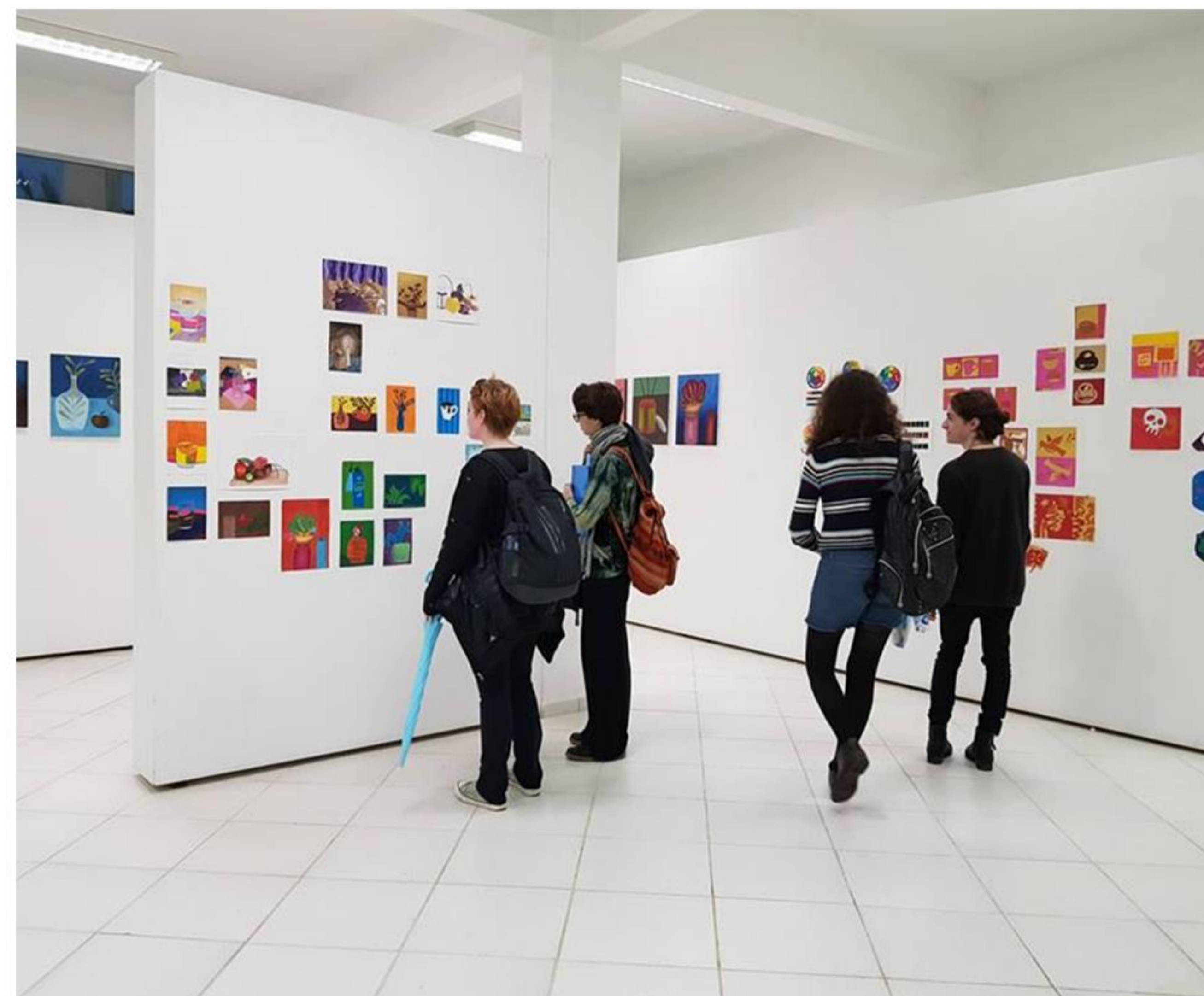
Figura 2. Espaço da Galeria Experimental do DAV com a mostra de trabalhos da disciplina de Introdução à Linguagem Pictórica.