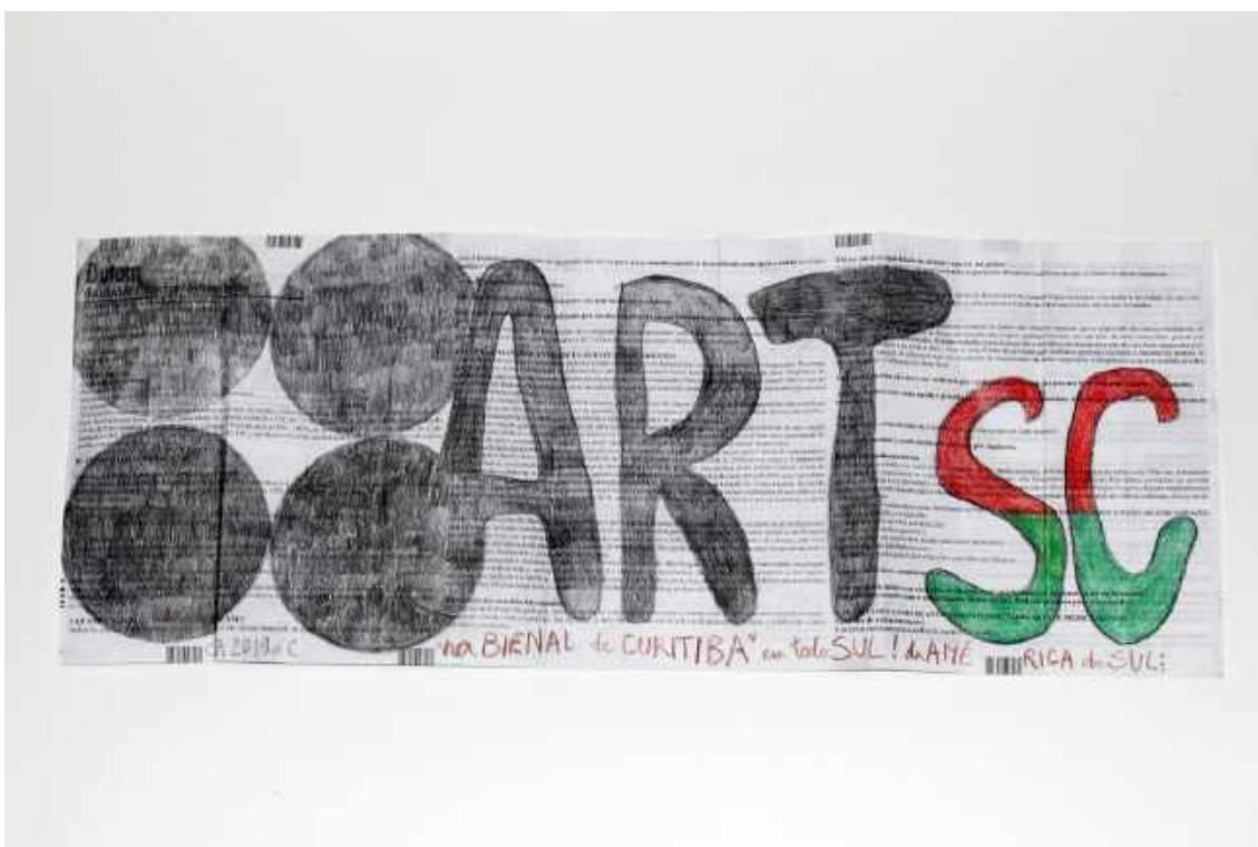
ART SC, 2019, de Carlos Asp. Dimensões: 22 x 56 cm. Técnica: Lápis de cor sobre bula de remédio.

Carlos Asp é contador das suas histórias repetidas vezes e é também narrador de novas histórias – histórias atemporais. Palavra-desenho que rompe a fronteira do tempo, para atravessar os tempos possíveis, em anacronismo, desvio, vertigem, aproximações dos personagens ao espectador e em teias de afetos. Do artista errante, andarilho, irrompe um processo vigoroso de produção, baseado em materiais descartados. Descartáveis tornam-se suportes de obras, de exposições ambulantes que leva consigo, folhas, cadernetas, pequenos textos, desenhos, sinalizam a tentativa de retenção do tempo, mesmo que anárquico. Des(e)poemas é uma exposição que comemora uma vida, por obras que se realizam em um processo de pulsão, que retiram de seu cotidiano, da poesia visual colhida pelo artista, aproximação entre arte e vida.