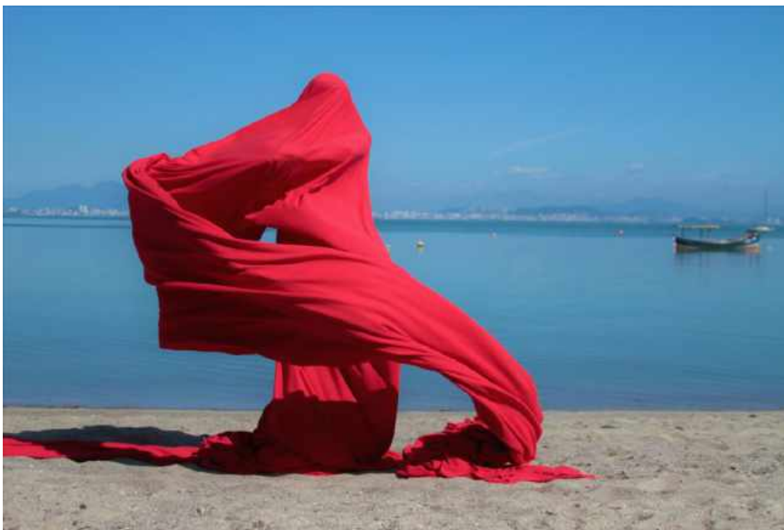
Still do vídeo registro da performance Almacorpomarterra , 2019. Praia do Sambaqui, Florianópolis.

com mar e terra, o ambiente da Praia do Sambaqui em Florianópolis e o Espaço Cultural Armazém – Coletivo Elza, como um site specific para as relações fronteiriças entre corpo e alma, presença-ausência, espaço e ambiência.