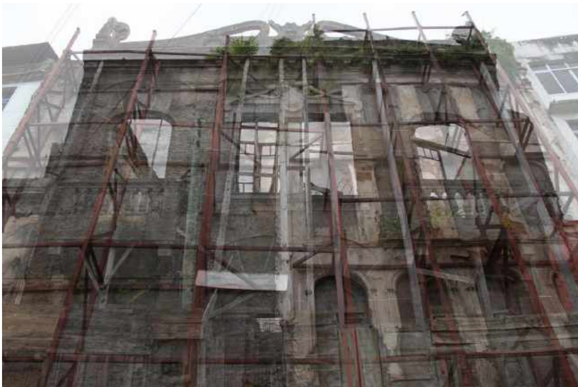
Estruturas de sustentação , 2019, de Beatriz Rodrigues. Dimensões: 85 x 120 cm. Técnica: Fotografia em papel vegetal. Foto: div.

Pelas palavras do curador da mostra “seus processos de coleta são uma tentativa de fazer durar aquilo que tende a ruir e escapar por entre os dedos. Assim como Nuno Ramos, Beatriz começou a arrancar a pele das coisas para ver o que havia debaixo, percebeu que a pele dos tijolos ia virando pó. Como se tentasse capturar o pó com uma peneira, seus trabalhos de inventário são uma pequena fração de moléculas capturadas de uma matéria que se esvai com o passar do tempo.”