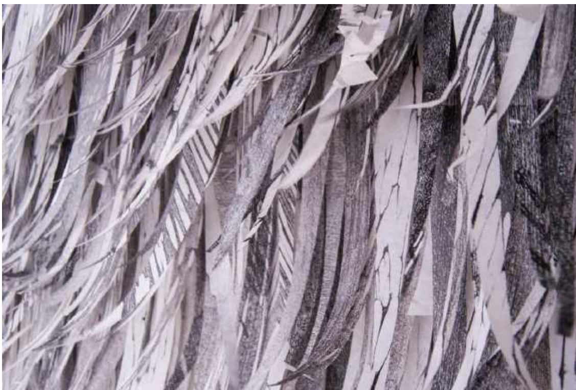
Detalhe da obra Da série Pelas peles, pelas penas, pelos pelos , 2002. Dimensões: 0,51 x 1,38 cm. Técnica: tiras recortadas de impressões xilográficas sobre papel sulfurizê em tons pretos, coladas sobre papel sulfurizêa.

e lírica da matéria. Inventam outros mundos, como se referia Henri Focillon ao próprio papel da arte, e assumem a condição primária da natureza, renovadora, encontrando outras formas nas formas das coisas.