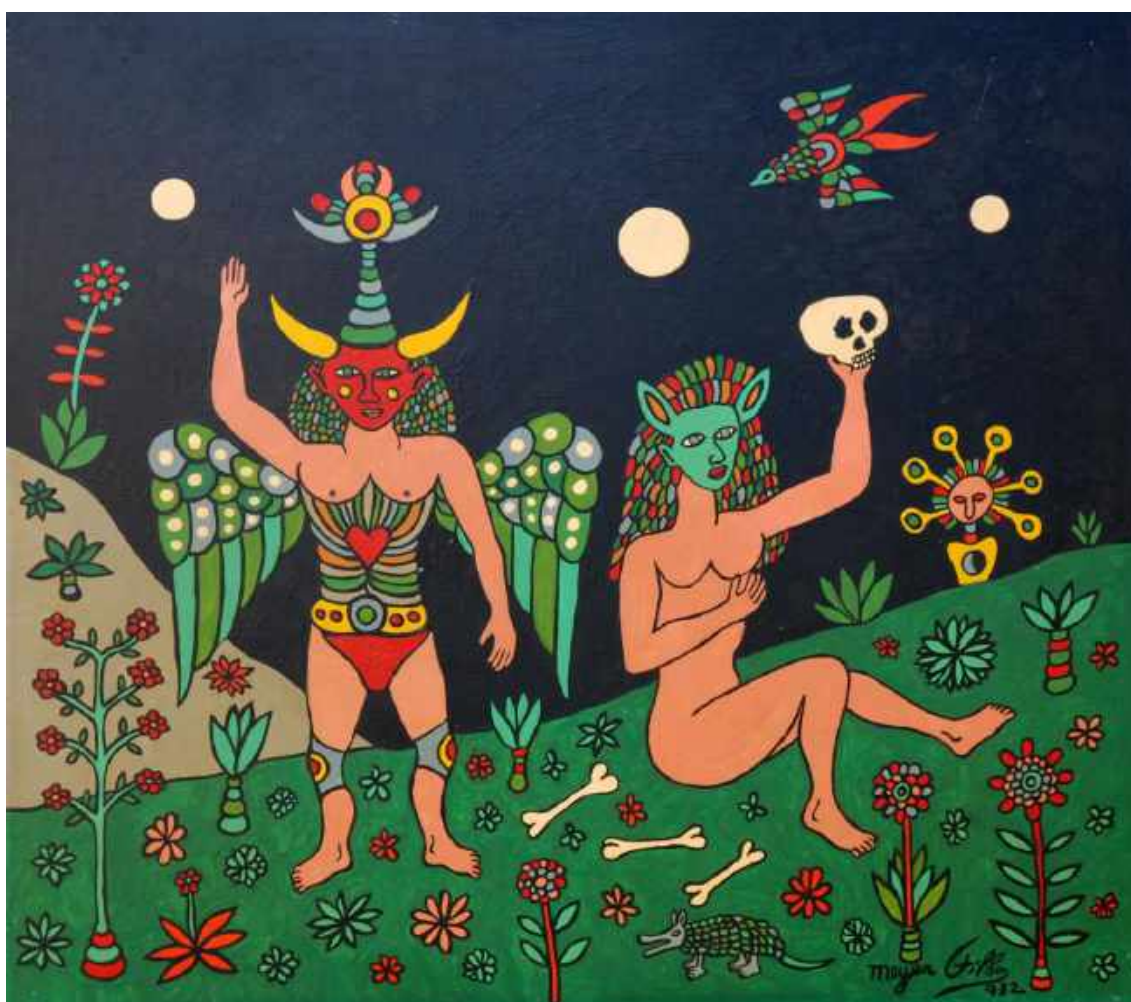
Feiticeiros Cósmicos , 1972, de Meyer Filho. Dimensão: 60 x 68 cm. Técnica: Tinta acrílica sobre Eucatex.

A exposição trata de uma relação entre fronteiras abertas de sonhos, devaneios e realidades que permeiam nossas relações com seres animados e inanimados, no imenso cosmos.