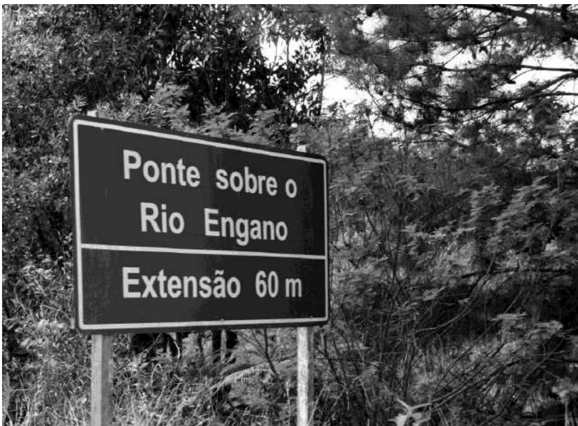
Rio Engano, 2016, de Helder Martinovsky e Raquel Stolf.

Por fim, “estudos de rios” apresenta fotografias em preto e branco, de Helder Martinovsky, sobre a pesquisa. O estudo “envolve fotografar o que se dilata, entre vazio denso, desenho de luz e massa silenciosa. O rio, sobretudo, é opaco. Calado, não tem um dentro acessível, estável, estabilizável. O rio corre o tempo todo. O rio concentra algo de mistério.” (texto dos artistas sobre a exposição)