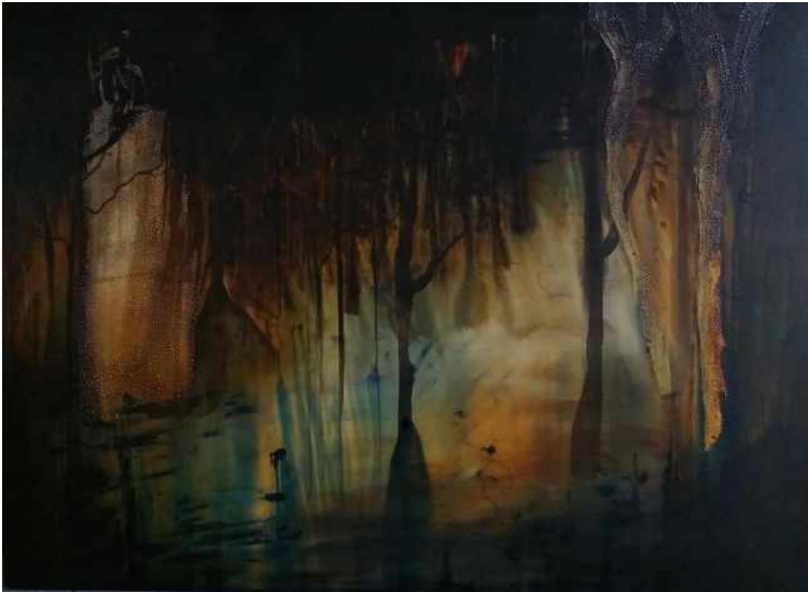
Sem Título , Da Série “The Surviving Forest”, 2019. Dimensões: 110 x 150 cm. Técnica mista sobre tela: Acrílica e massa acrílica.

Essa forma de pensamento que ressalta a paisagem enquanto arte, materializada nas variantes das pinturas, impressões e instalações, privilegia o sentido da visão que reverbera nas afecções possíveis diante das imagens realizadas pela artista. Assim, o sujeito perante essas Florestas cria um ato de adesão da sensação de paisagem que o faz perceber o risco da perda.