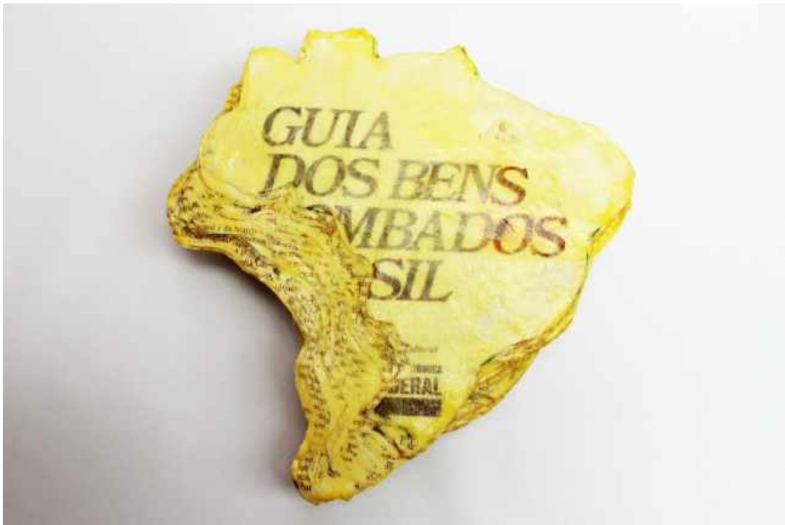
Guia dos Bens Tomados do Brasil II , 2018, de Sérgio Adriano H. Dimensões: 20 x 20 x 3,5 cm. Técnica: Mapa formado com recorte 526 páginas do livro Guia dos Bens Tombados do Brasil | 2/10.

“Índice” nos propõe uma experiência que não se refere somente ao território da fronteira do pensamento, mas que permite a noção de pertencimento do fato, a aproximação entre fronteiras invisíveis e visíveis. Sergio Adriano H propõe uma nova coleção histórica, o registro de um acervo de peças que mostra as dualidades e barbaridades desse processo de tempo, um mapeamento de palavras, índices e imagens que permeiam o universo da discriminação e que perpetuam os desacertos entre história ocultada e a história dada a ver na significação da sociedade brasileira.