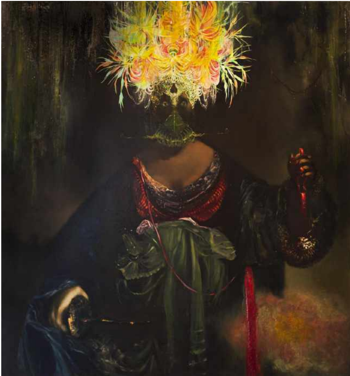
A Imperatriz Antropófaga , 2017, de Fernando Lindote. Dimensão 150 x 140 cm. Técnica: óleo sobre tela. Coleção Jeanine e Marcelo Collaço Paulo.