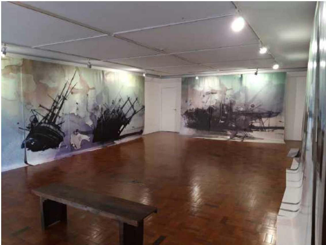
Vista da exposição Extravios , da artista Lela Martorano. Galeria Municipal de Arte Pedro Paulo Vecchietti, 2019.

Os Extravios das embarcações que a instalação de Lela propõe, ativam a noção de reconhecença e sinalizam o território poético e amargo do desaparecimento.