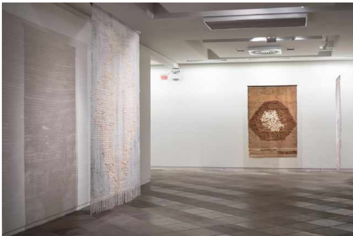
Vista da exposição Páginas Avulsas , da artista Clara Fernandes. Museu de Arte de Santa Catarina, 2019.

Páginas Avulsas sussurram ao espectador lembranças e seus possíveis esquecimentos de intimidades que redesenham novas histórias, quando atravessadas pelo processo criativo da artista. Na leveza das páginas, Clara incorpora o papel de narradora que recebe matérias e lança-as em movimento, disparando diferenças, devolvendo o que recebe em histórias abertas, fluídas, que falam sobre planos de diferença-repetição, encontros-desencontros, materialidade-imaterialidade, sonho-realidade. O entre aqui fala sobre o que está no meio de; no intervalo de; dentro de; esse entre que se instala na visibilidade e invisibilidade, entre o mundo de significações individuais e coletivas, entre o que se pode ver e o não ver, o que se pode tocar e o impalpável.