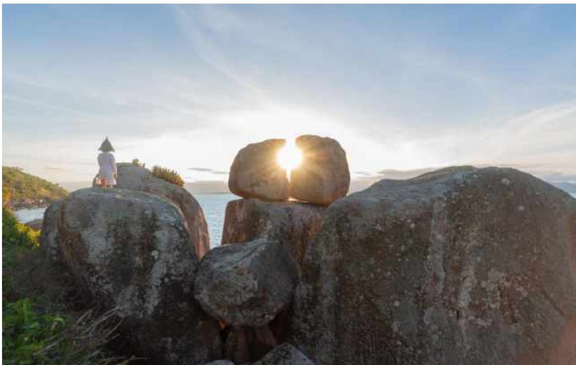
Mono-marco , 2018, de Amanda Melo da Mota. Dimensões: 0,50 x 0,80cm. Técnica: Fotografia.

Amanda percorre as regiões da ilha nos períodos desses eventos para inserir-se na paisagem e nela fazer parte. Mapeia os tempos e por eles perfura o passado, devolvendo-o ao presente, nessa investigação que parte também de ações performáticas realizadas pela artista.