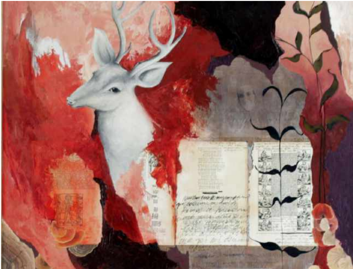
Detalhe da obra Informes , 2018, de Meg Tomio Roussenq. Dimensão 80 x 110 cm. Técnica: óleo sobre madeira.

Entre a matéria e o impalpável, Des-tempo imerge das fronteiras do corpo-carne-pensamento, em cores vibrantes resulta desta mostra uma intensidade visceral que fala sobre dissipação, uma intensidade que desvela a consumição, indiscernibilidade da pintura como potencial de “desterritorialização” que a artista se encarrega de anunciar pelo corpo pictórico que cria.