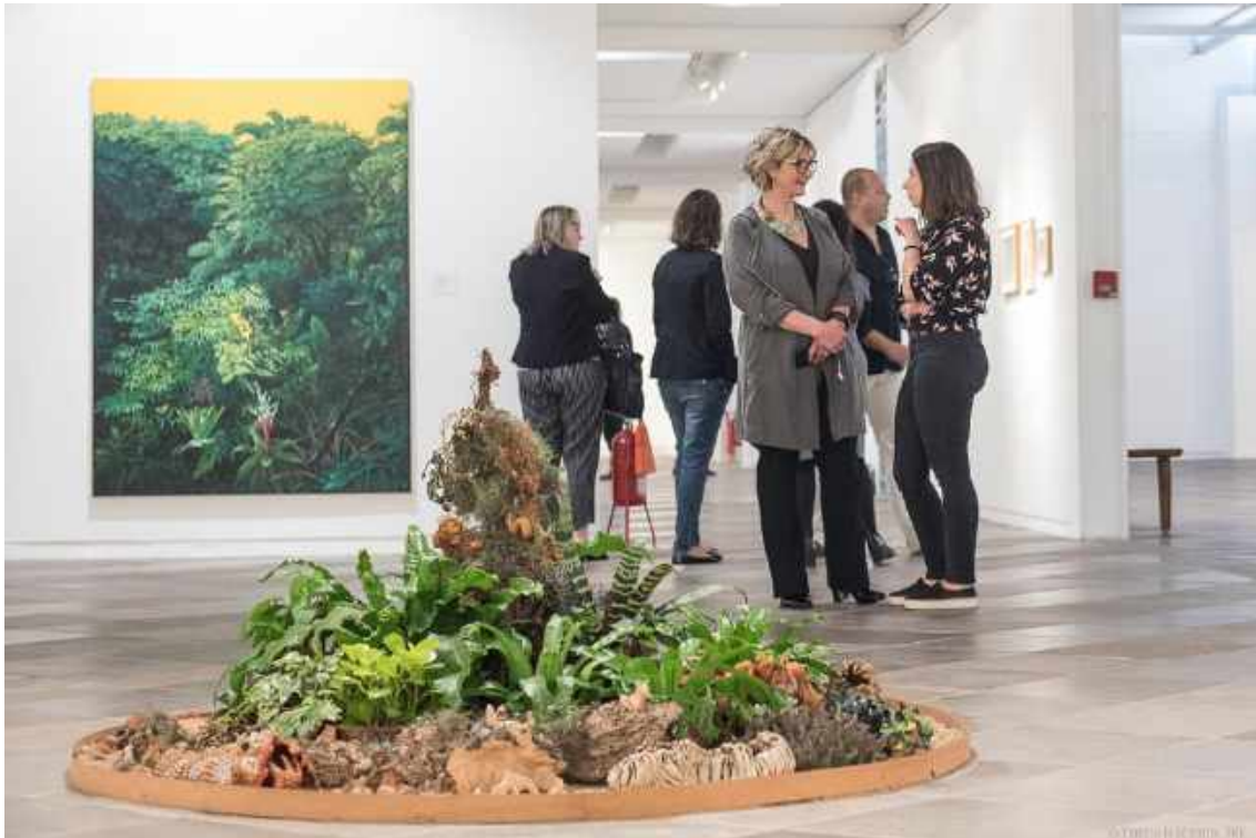
Vista da exposição coletiva Fronteiras em Aberto . Museu de Arte de Santa Catarina, 2019.