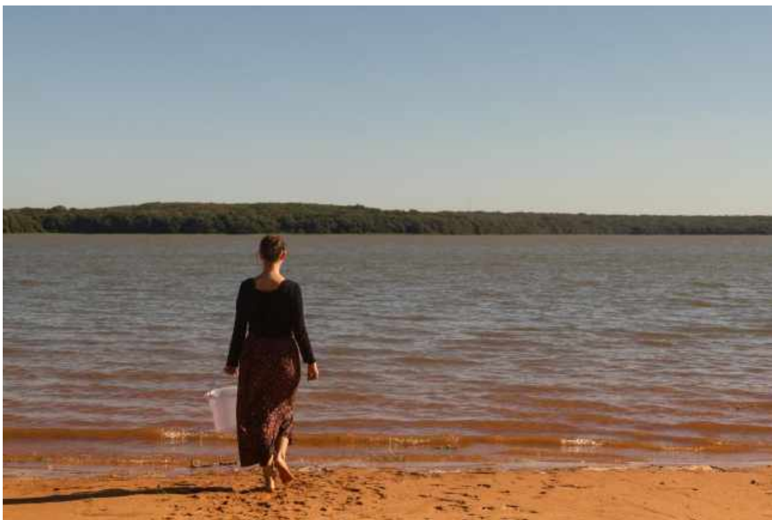
Still do vídeo Duas margens , 2019, de Fran Favero.

Apresenta vídeos, fotografias, trabalhos sonoros e outras proposições que acionam fluxos por entre orlas e palavras memoriosas e fronteiriças. Travessias, (in)traduções e erosões acionam relações e enfrentamentos outros entre corpo, fala e espaço, entre lábios, línguas e margens, para além daqueles estabelecidos por barreiras fixas e pelos Estados-nações.