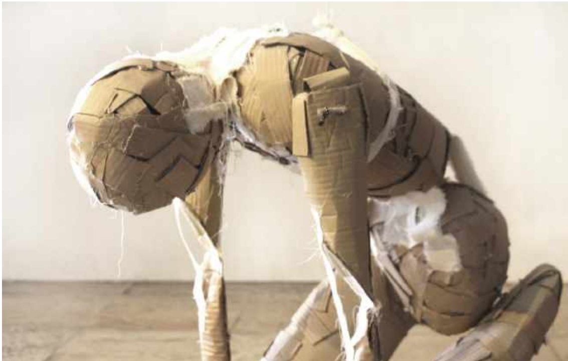
Fardo , 2019, de Diego de los Campos. Dimensões: 300 x 300 x 154 cm. Técnica: Instalação cinética, madeira, papelão, tecido, Arduino.