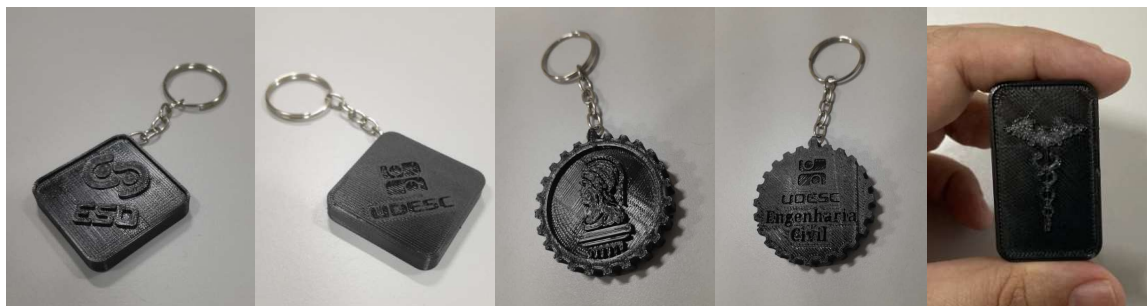
Quantidade produzida: cerca de 100 chaveiros para cada curso

Administração: Chaveiros dos cursos de graduação