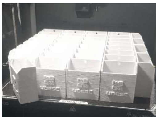
Quantidade produzida: cerca de 60 porta-controles

Administração: Chaveiros dos cursos de graduação