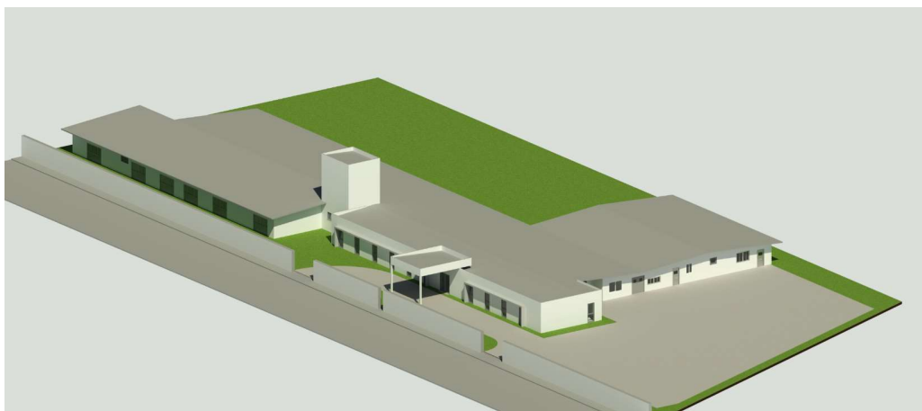
Modelagem tridimensional do novo prédio da APAE para posterior confecção da maquete física