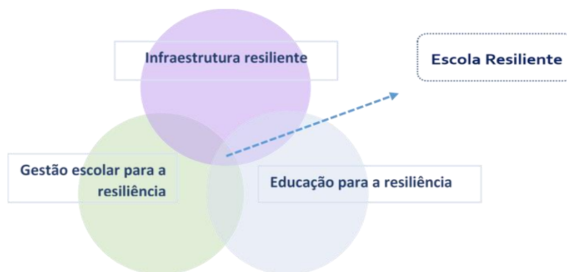
Figura 2 – Eixos fundamentais para construir escolas resilientes

A redução de riscos e desastres nos ambientes educacionais é defendida pelo programa Iniciativa Global para Escolas Seguras da UNISDR ( World Wide Initiative for Safe Schools ), reforçado pela Lei 12.608/2012 (Lei da Proteção e Defesa Civil do Brasil). São eixos fundamentais para construir Escolas Resilientes (Figura 2), segundo UNISDR (2014):