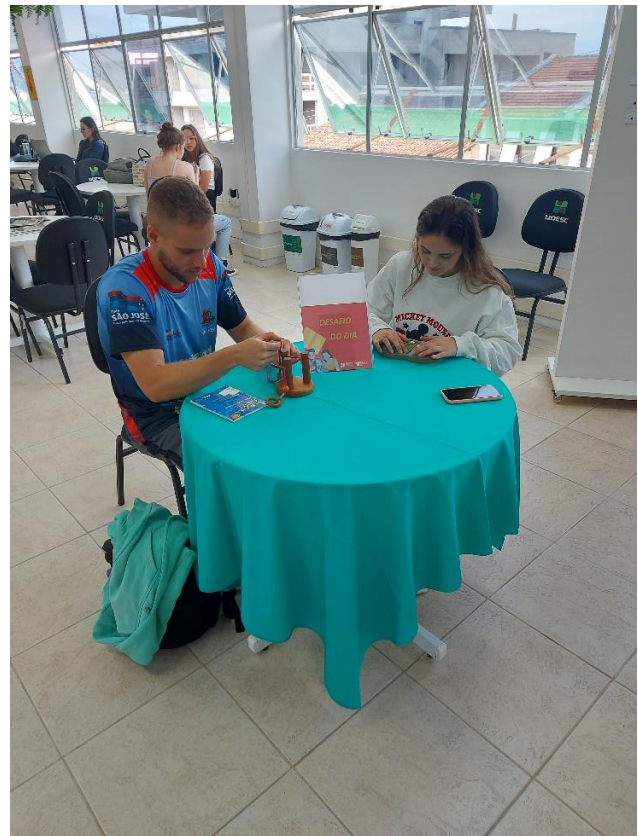
Desafio dos jogos