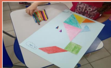
Imagens das figuras dos alunos