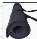
Tapetinho de Yoga