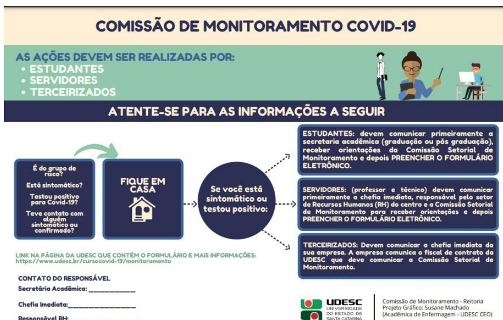
Figura 5: Fluxo de comunicação de casos na UDESC

FONTE: Link de acesso: https://www.udesc.br/cursocovid-19/monitoramento