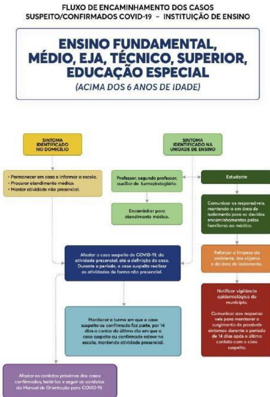
Figura 6: Fluxo dos casos suspeitos ou confirmados de COVID-19 na Instituição de Ensino