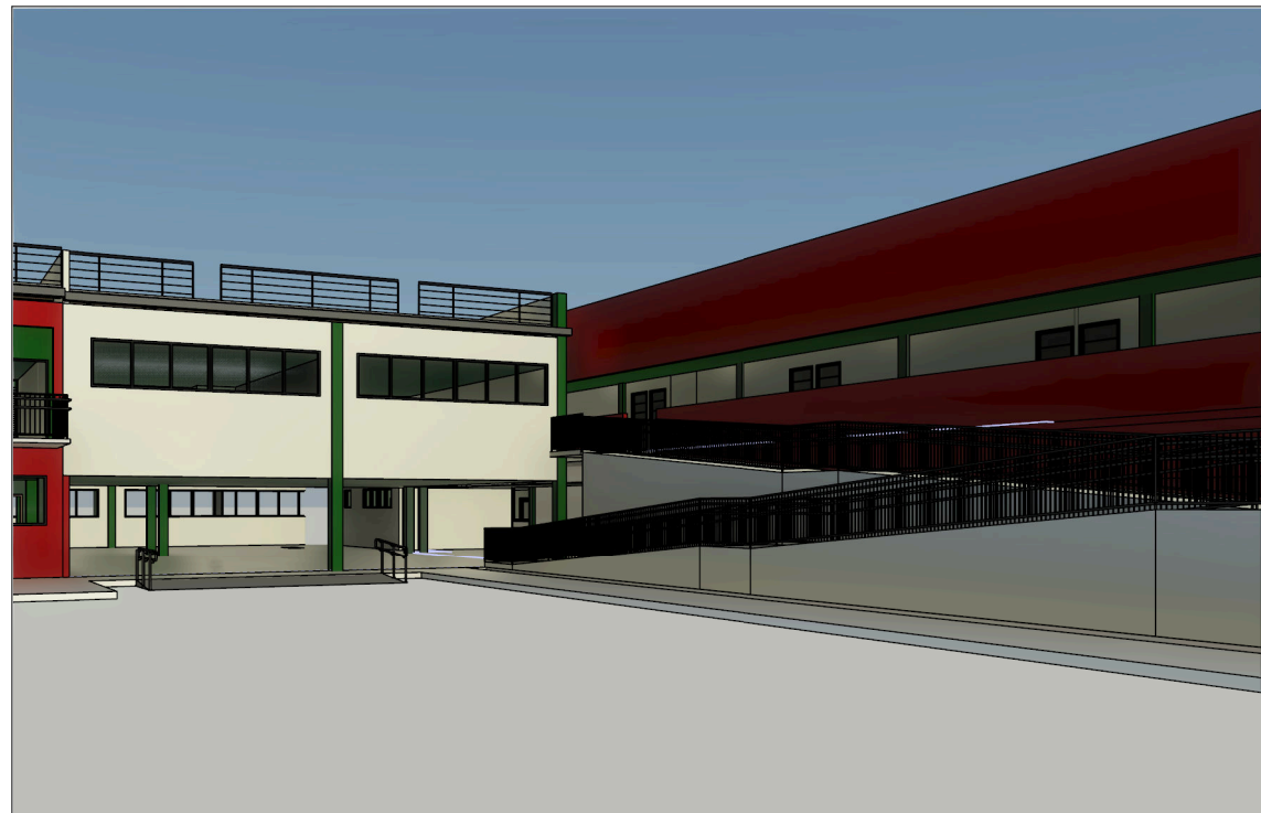
4 Vista 3D 07