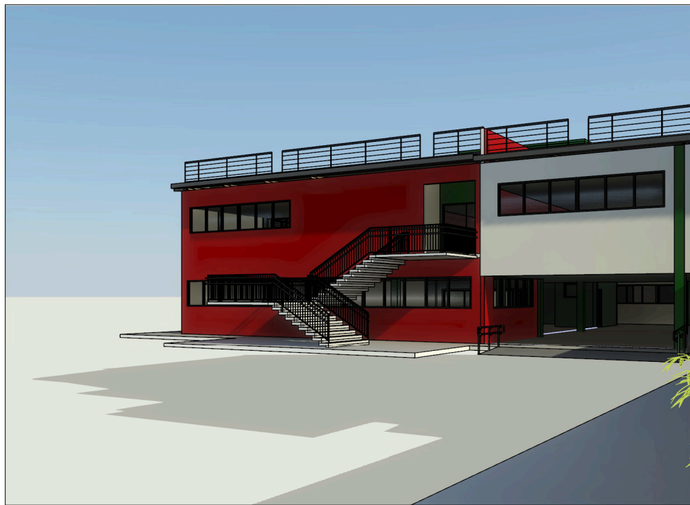
5 Vista 3D 08