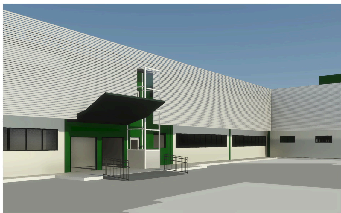
6 Vista 3D 09