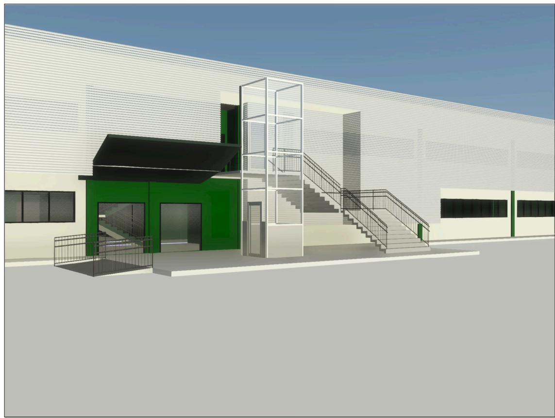
3 Vista 3D 06