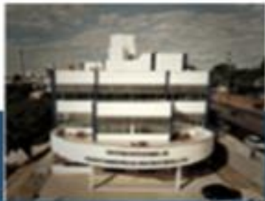
Proteção e Defesa Civil