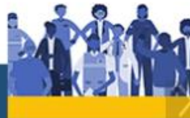
Mini Cursos Gestão de Desastres