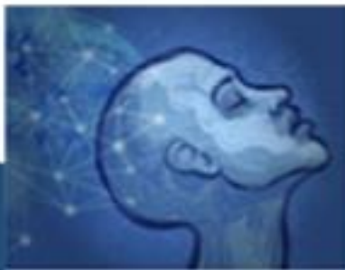
Psicologia das Emergências e dos Desastres aplicada às ações da Defesa Civil