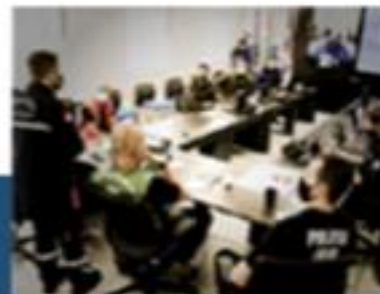
Sistema de Comando em Operações (SCO)