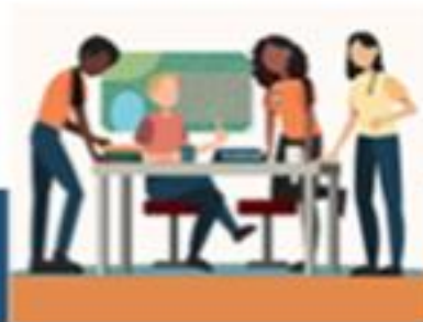
Mini Cursos Gestão de Risco