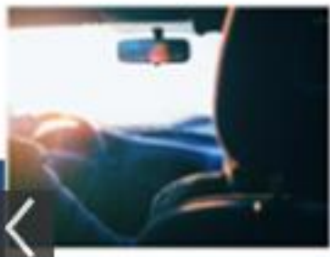
Condutores de Veículos Oficiais (CCVO)