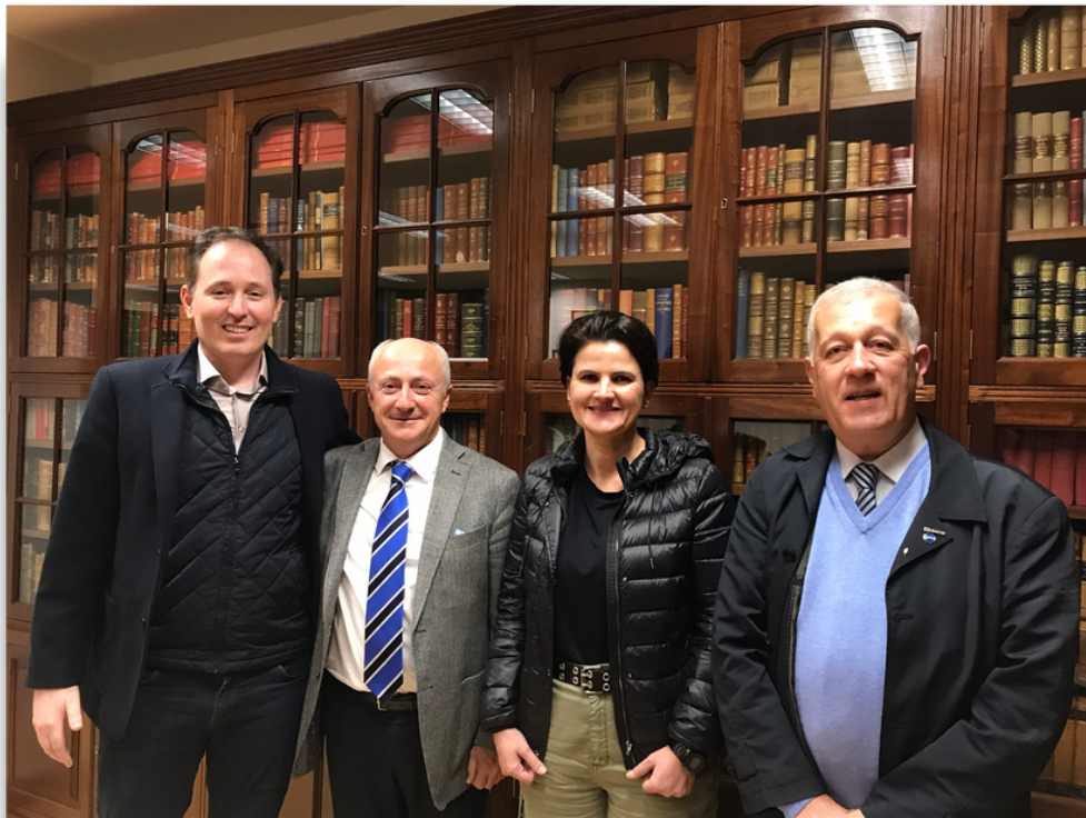
Leonardo Secchi/Arquivo Pessoal

V Congresso Lusófono de Gestão de Recursos Humanos e Administração Pública (Flag), no ISCSP/ULisboa, com a participação de uma comitiva da Udesc Esag.