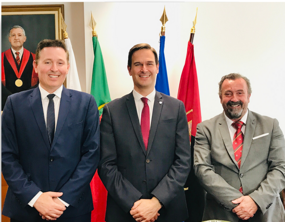
Leonardo Secchi/Arquivo Pessoal