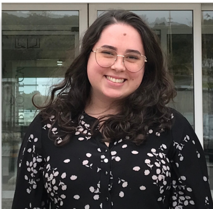
Leonardo Secchi/Arquivo Pessoal

Qual será o tema de tua dissertação? Em que área você vai se especializar?