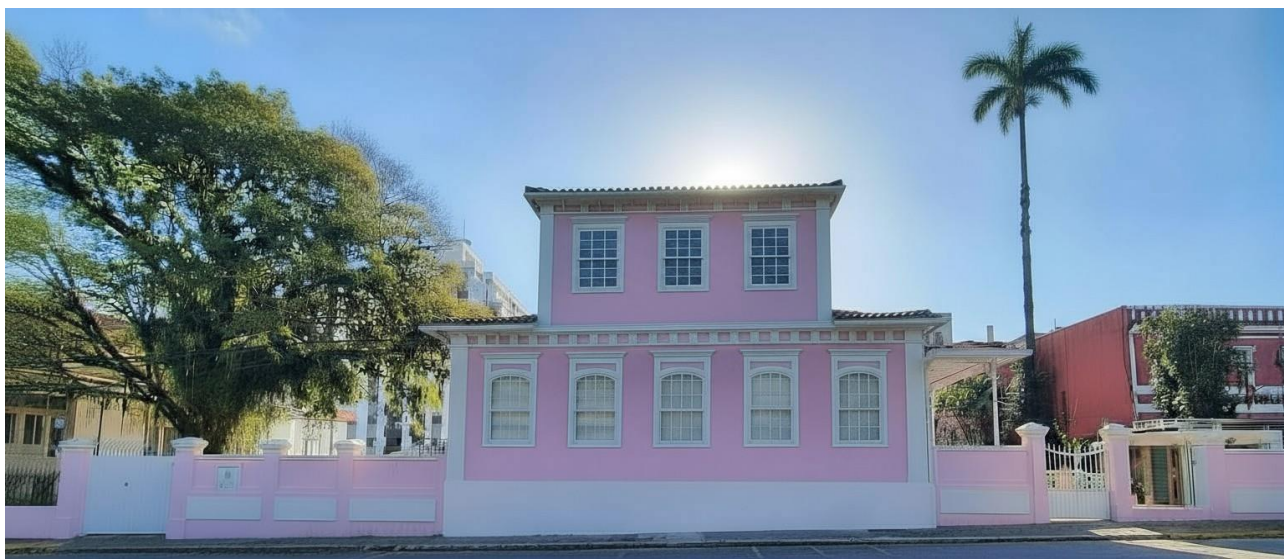
Imagem 3 – Fachada da Casa Rosa, sede histórica do IDCH, Centro, após o restauro

(*Fios e Carros retirados por meio de IA generativa).