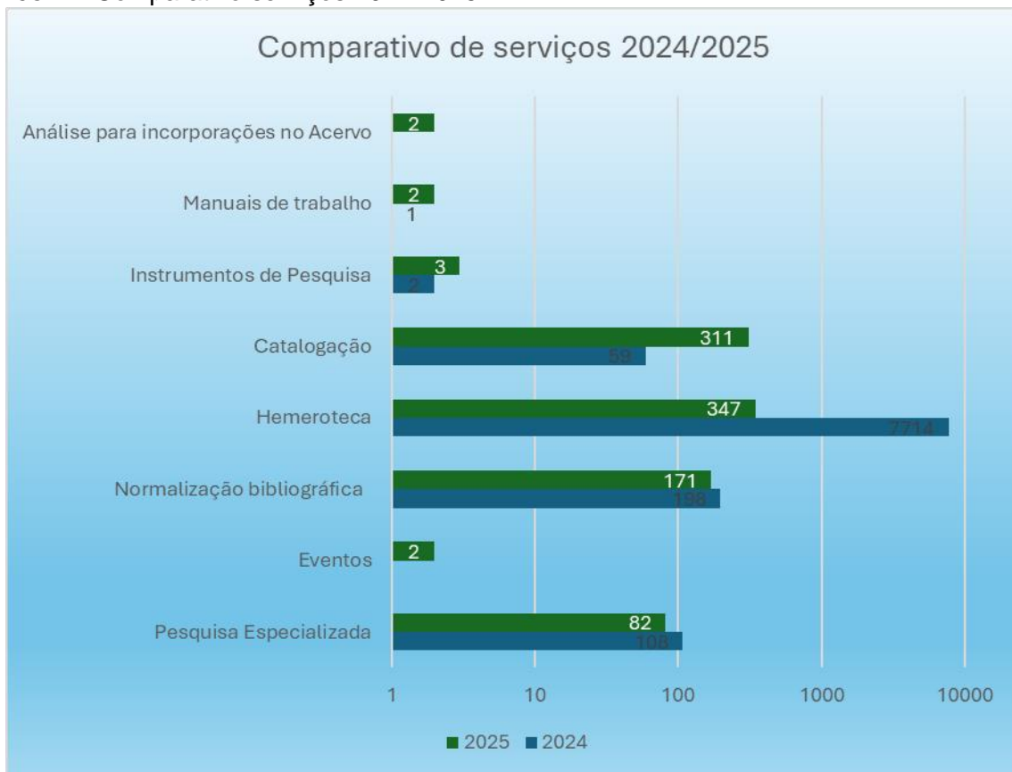
Gráfico 1 - Comparativo serviços 2024-2025