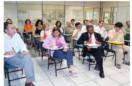
Reunião do GTC, na EPAGRI