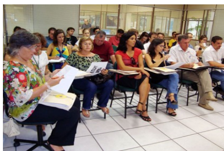
Reunião do GTC, na EPAGRI

A principal defesa do grupo da UDESC junto ao GTC foi incentivar a CRIAÇÃO de um BANCO de DADOS AMBIENTAIS para o Estado de Santa Catarina, público e aberto, que permitisse a consulta pela Internet, e congregasse num mesmo lugar todas as informações necessárias para subsidiar de ações de prevenção.