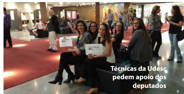
Técnicas da Udesc pedem apoio dos deputados

VOCÊ LEMBRA? Uma das grandes conquistas da gestão em 2016, com apoio de diretores gerais, associações e sindicato, foi o aumento em 50% no valor do auxílio-alimentação, além da reposição de 4,2% no VRV para os servidores da Udesc. A medida ocorreu em um ano de crise econômica e contribuiu para corrigir parcialmente as perdas com a inflação que impactaram no salário dos servidores.