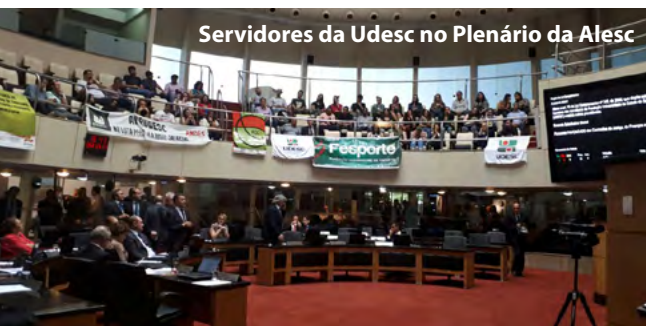
Servidores da Udesc no Plenário da Alesc

No entanto, o governador do Estado na época, Raimundo Colombo, sancionou a lei com retroação a partir de 1º de outubro. A Udesc busca, desde então, que o veto parcial seja derrubado pelos deputados estaduais no Plenário da Alesc.