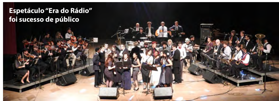
Espectáculo “Era do Rádio” foi sucesso de público