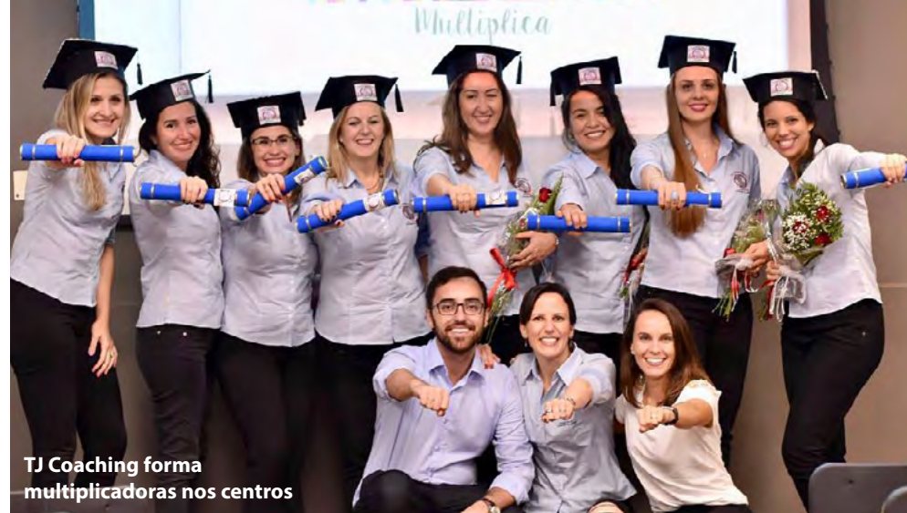
TJ Coaching forma multiplicadoras nos centros