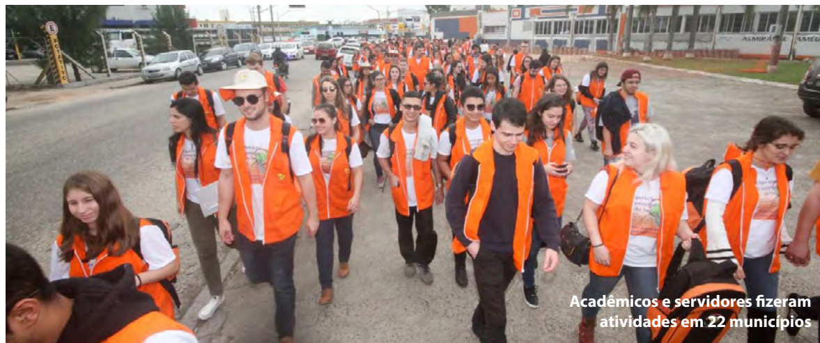
Acadêmicos e servidores fizeram atividades em 22 municípios

O Núcleo Extensionista Rondon (NER), da Udesc, ligado à Pró-Reitoria de Extensão, Cultura e Comunidade (Proex), realizou em julho a Operação Caminhos do Sul em 22 municípios das agências de Desenvolvimento Regional (ADR) de Braço do Norte, Criciúma, Laguna e Tubarão. Acadêmicos e servidores da universidade e voluntários promoveram ao longo de 11 dias oficinas das oito áreas da extensão universitária: educação; saúde; meio ambiente; direitos humanos e justiça; cultura; comunicação; trabalho; e tecnologia e produção. Em 12 operações, feitas a partir de 2010, o NER já realizou cerca de 9,1 mil atividades, envolvendo 2,3 mil rondonistas e a participação de um público de mais de 275 mil pessoas em 114 municípios de Santa Catarina, seis do Paraná, cinco de Goiás e um da Argentina.