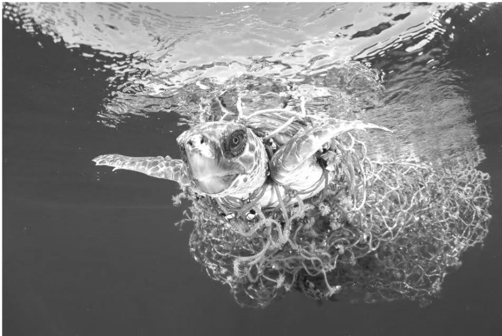
Tartaruga-marinha emaranhada por rede de pesca.