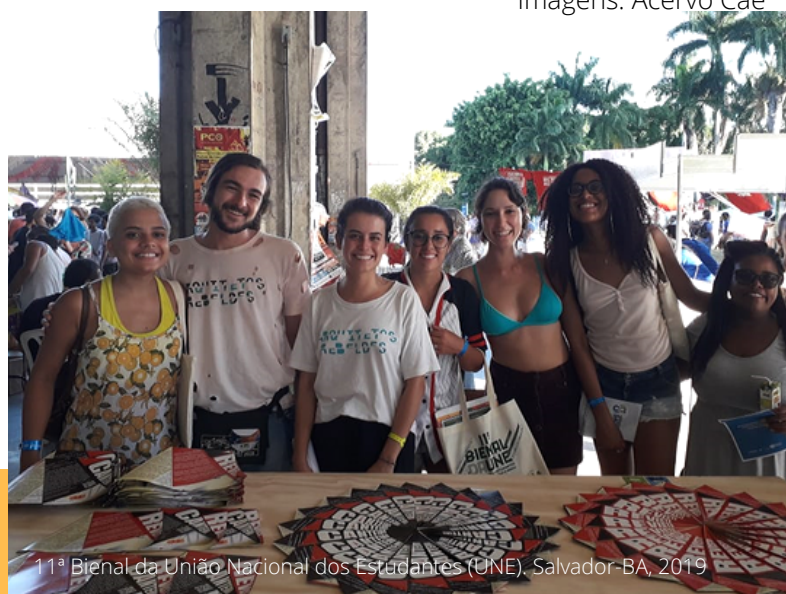
11ª Bienal da União Nacional dos Estudantes (UNE), Salvador-BA, 2019