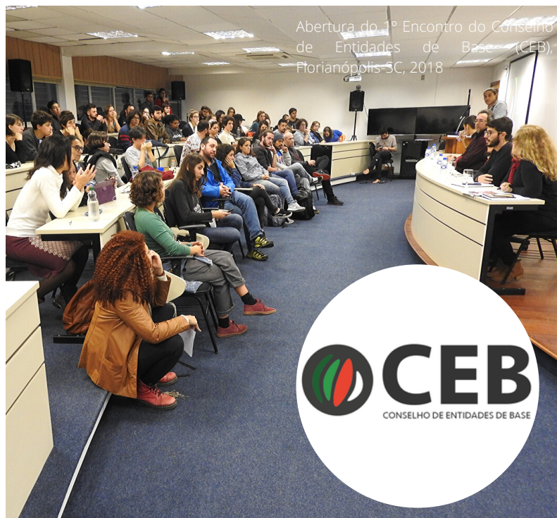
Abertura do 1º Encontro do Conselho de Entidades de Base (CEB), Florianópolis-SC, 2018