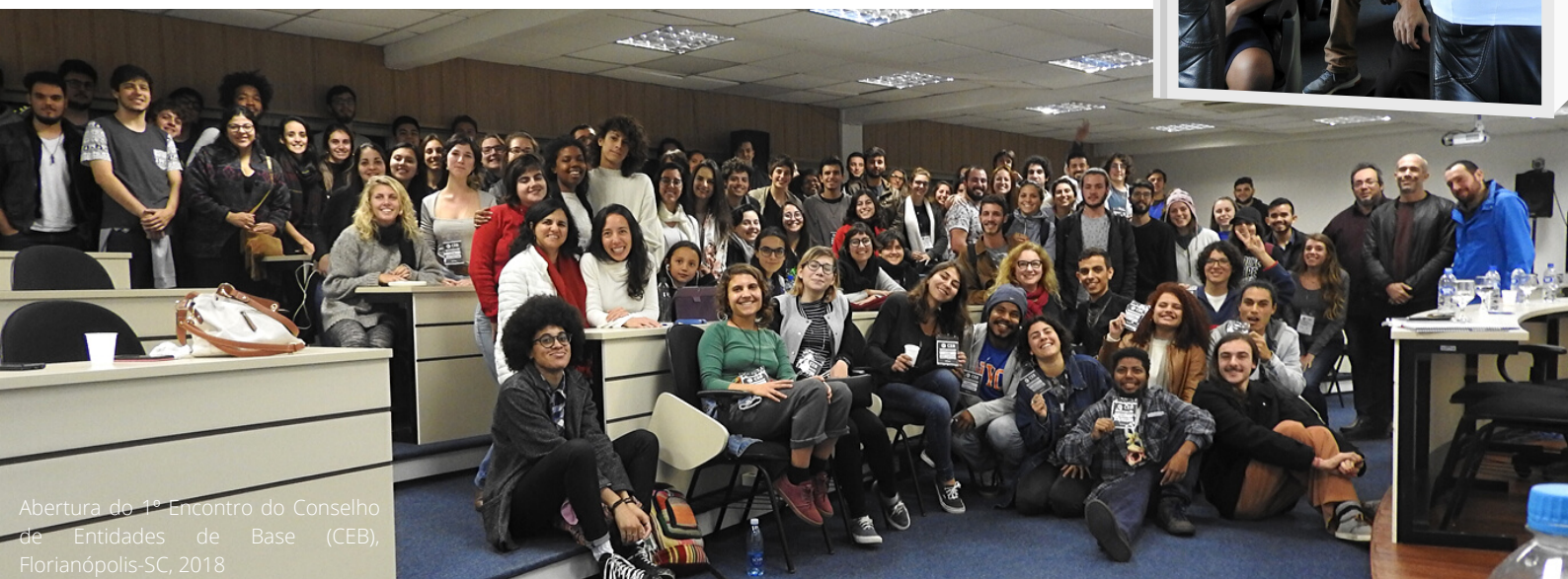
Abertura do 1º Encontro do Conselho de Entidades de Base (CEB), Florianópolis-SC, 2018