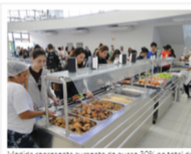
Medida representa aumento de quase 30% no total de auxílios atualmente concedidos

A partir de agosto, a Universidade do Estado de Santa Catarina (Udesc) concederá auxílios de alimentação e de moradia do Programa de Auxílio Financeiro aos Estudantes em Situação de Vulnerabilidade Socioeconômica (Prafe) a todos os alunos da instituição em situação comprovada de vulnerabilidade social, ou seja, que pertençam a grupos familiares com renda per capita de até um salário mínimo e meio.