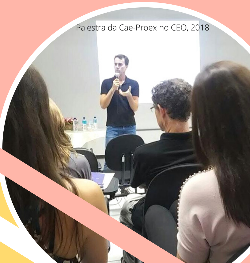
Palestra da Cae-Proex no CEO, 2018