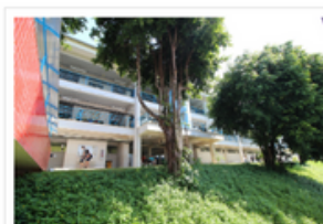
Universidade lançará editais em janeiro para estudante em vulnerabilidade socioeconômica

Em sessão realizada nesta quinta-feira, 13, o Conselho Universitário (Consuni) aprovou a criação do Programa de Auxílio Financeiro aos Estudantes em Situação de Vulnerabilidade Socioeconômica (Prafe) na Universidade do Estado de Santa Catarina (Udesc). A resolução será publicada em breve, na página da Secretária dos Conselhos Superiores (Secon) .