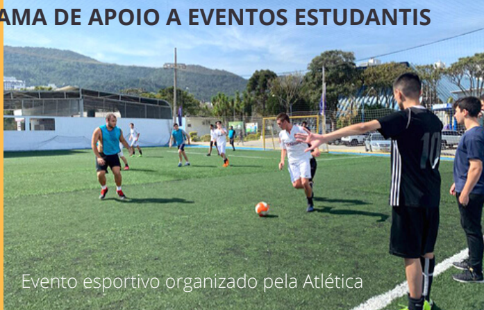
Evento esportivo organizado pela Atlética

Com edição anual, o programa já destinou quase R$ 130 mil reais à entidades estudantis reconhecidas institucionalmente pela Udesc, movimento estudantil, atléticas e empresas juniores. O apoio a participação e a organização de eventos abrange desde programações locais a internacionais, com caráter pedagógico, científico, tecnológico, cultural, esportivo e político. Os valores reservados englobam as despesas de auxílio-inscrição, auxílio-hospedagem, auxílio-transporte, auxílio-alimentação, pró-labore a palestrantes e também despesas possíveis de análise pela administração, visando facilitar a atividade estudantil.