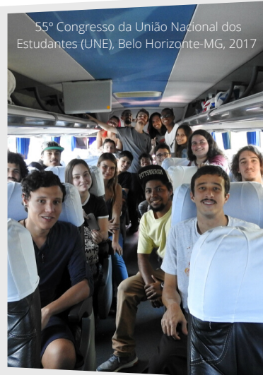
55º Congresso da União Nacional dos Estudantes (UNE), Belo Horizonte-MG, 2017

A CAE apoiou o movimento estudantil da Udesc na participação de representantes da Universidade nos Congressos e na Bienal da União Nacional dos Estudantes (UNE), no Conselho de Entidades de Bases (CONEB), no Encontro de Grêmios da UBES (ENG), no Encontro Nacional de Pós-Graduandos (ENPG), na co-organização dos Congressos da UCE, na organização dos Encontros do Conselho de Entidades de Base da Udesc etc. Temas candentes sobre questões conjunturais, educacionais e de organização estudantil foram debatidos, a exemplo da reativação do DCE-UDESC e da política de assuntos estudantis, qualidade e cortes orçamentários na educação brasileira. A CAE defendeu o caráter cidadão e pedagógico envolto à participação de discentes da Udesc no movimento estudantil.