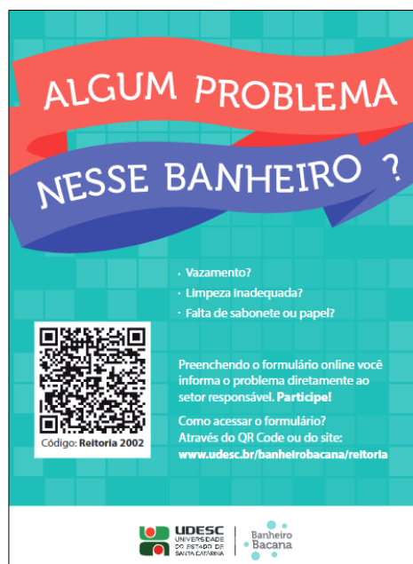
Modelo de Plaquinha utilizada nos banheiros