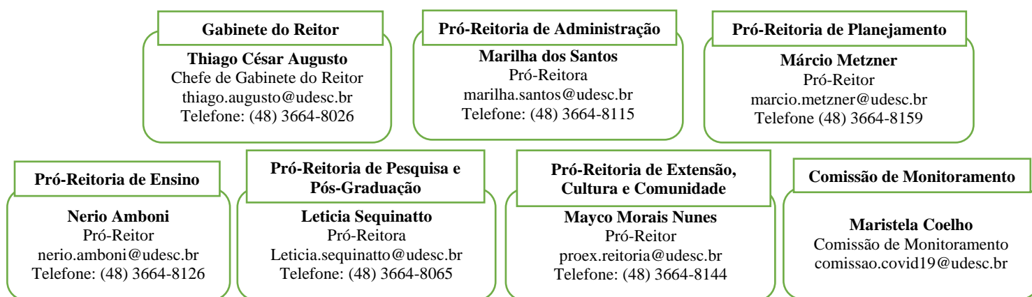
Organograma da Unidade de Gestão Operacional da UDESC/REITORIA.

Para tanto, a UDESC/REITORIA apresenta o organograma de sua Unidade de Gestão Operacional, em que cada pessoa identificada tem poder de decisão sobre uma situação crítica. Para facilitar a utilização e visibilidade, sugere-se a socialização das informações em murais, site, sistemas, indicando os responsáveis e contatos.