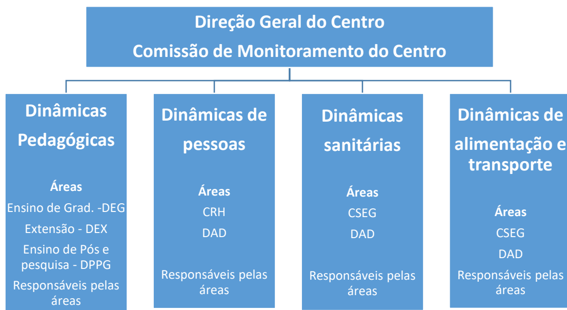
Organograma da Unidade de Gestão Operacional da UDESC /ESAG.

Para tanto, a UDESC/ESAG apresenta o organograma de sua Unidade de Gestão Operacional, em que cada pessoa identificada tem poder de decisão sobre uma situação crítica. Para facilitar a utilização e visibilidade, sugere-se a socialização das informações em murais, site, sistemas, indicando os responsáveis e contatos de emergência.