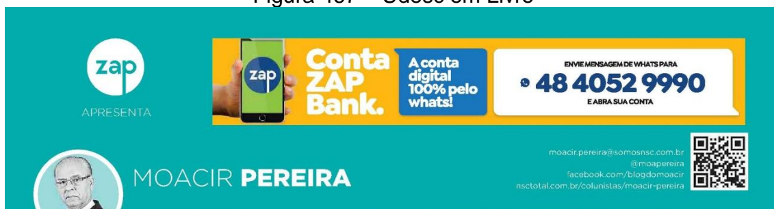
Figura 467 – Udesc em Livro