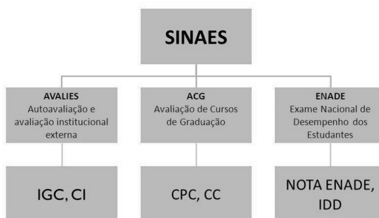
Figura 3 Componentes do SINAES

O processo da avaliação subdivide-se em duas perspectivas: