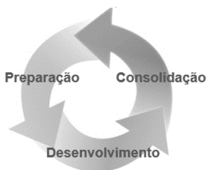
Figura 4 Etapas do processo avaliativo

Cada ciclo do processo (preparação-desenvolvimento-consolidação), envolve diferentes atores, objetos, instrumentos e indicadores.