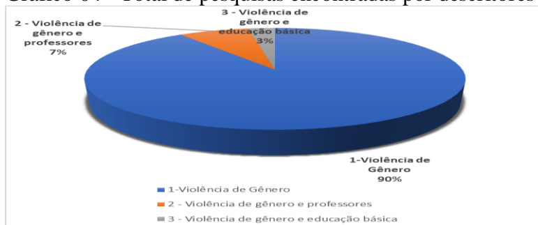
Gráfico 04 - Total de pesquisas encontradas por descritores