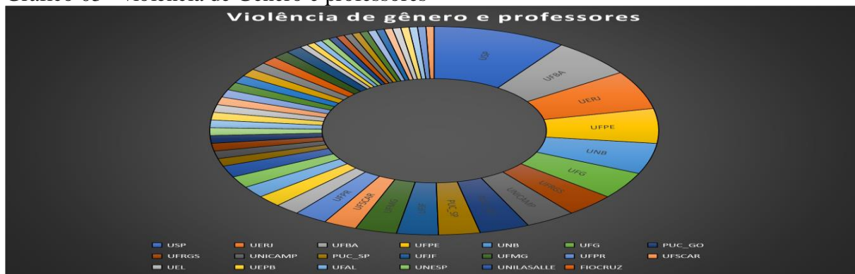
Gráfico 03 - violência de Gênero e professores

Fonte: Elaborado pelas pesquisadoras, 2022.