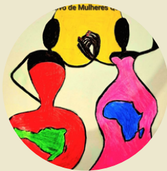
Diálogos com o Coletivo de Mulheres Quilombolas de Santa Catarina