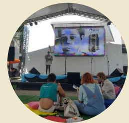
Diálogos com a calourada CEART/UDESC