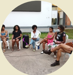
Diálogos na roda de conversa "10 anos de cotas" NUDHA/CEART/UDESC