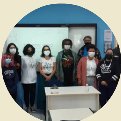
Encontro com turmas de Biblioteconomia e História FAED/UDESC

Nos anos de 2022 e 2023, integrantes da CAAD participaram de várias rodas de conversas com discentes e docentes em eventos pertinentes, estabelecendo o diálogo sobre os desafios, dificuldades e possibilidades de implantação de transformações no processo de permanência, currículo, acessibilidade e inclusão.