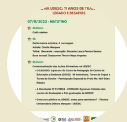
Diálogos no I Seminário de Ações Afirmativas na UDESC "Cotas na UDESC: 11 anos de trajetória - legado e desafios NEAB/UDESC