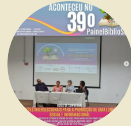
Diálogos na roda de conversa Tema: "Questões interseccionais para a promoção de uma equidade social e informacional" ACB/SC