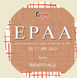
Formação na Escola de Políticas e Ações Afirmativas da ABPN