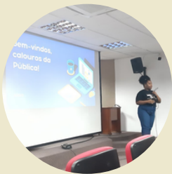
Diálogos com a calourada do Curso de Administração Pública ESAG/UDESC

Nos anos de 2022 e 2023, integrantes da CAAD participaram de várias rodas de conversas com discentes e docentes em eventos pertinentes, estabelecendo o diálogo sobre os desafios, dificuldades e possibilidades de implantação de transformações no processo de permanência, currículo, acessibilidade e inclusão.