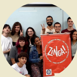
Diálogos sobre as Ações Afirmativas da UDESC com integrantes do Cursinho de Pré Vestibular da Zinga Florianópolis