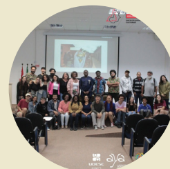
Conferência do Prof. Hippolyte Brice Sogbossi (UFS) no esquentado do 2º EPD "Panaficanismo e Ancestralidade: alguns apontamentos" e pontos de discussão com Ações Afirmativas - AYA/FAED/UDESC