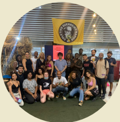
Diálogos com o Coletivo Negro Guerreiro Ramos ESAG/UDESC