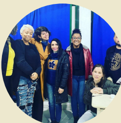
Encontro com turma Biblioteconomia EaD Polo de Apoio Presencial Blumenau FAED/UDESC