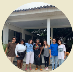
Diálogos com discentes do Centro Acadêmico de Arquitetura e Urbanismo - CERES/UDESC