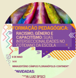
Diálogos na perspectiva interseccional a partir de raça, classe, gênero e deficiência IFSC/SC