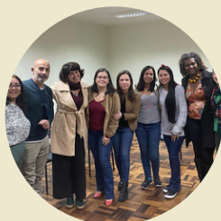
Encontro com turma Biblioteconomia EaD - Polo de Apoio Presencial Laguna FAED/UDESC