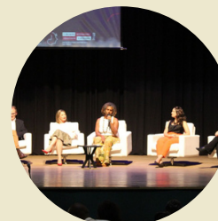
Participação na Abertura do 2º Encontro Internacional Pós-Colonial e Decolonial AYA/FAED/UDESC