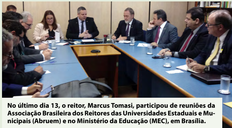
No último dia 13, o reitor, Marcus Tomasi, participou de reuniões da Associação Brasileira dos Reitores das Universidades Estaduais e Municipais (Abrium) e no Ministério da Educação (MEC), em Brasília.

O Gestão em Movimento apresenta momentos importantes da universidade, representados pela sua equipe de gestão, por meio de fotos. O objetivo é contribuir com a transparência, assim como prestar contas das atividades mais relevantes.