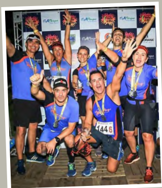
Maratonista, Bogo já correu provas internacionais