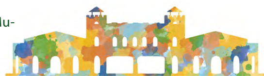
2º SIMPÓSIO INTERNACIONAL DE INOVAÇÃO EM EDUCAÇÃO SUPERIOR

◆ Na próxima quinta-feira, 20, encerrará o prazo para submissão de artigos científicos para o 2º Simpósio Internacional de Inovação em Educação Superior (Siies). Organizado pela Udesc e pela Associação Brasileira dos Reitores das Universidades Estaduais e Municipais (Abruem), o evento ocorrerá entre 11 e 13 de setembro, em Florianópolis. [LEIA+]