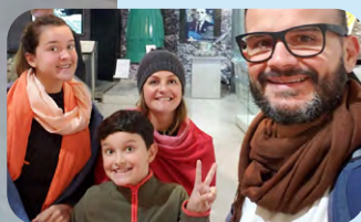
Jordan com a família