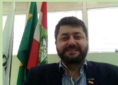
Baretta prestigiou a abertura da quarta edição do Parque das Profissões, realizado de forma online nesta quarta-feira, 24. Assista à gravação do evento.