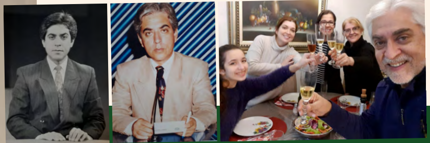
Salvador com a esposa, duas filhas e a neta