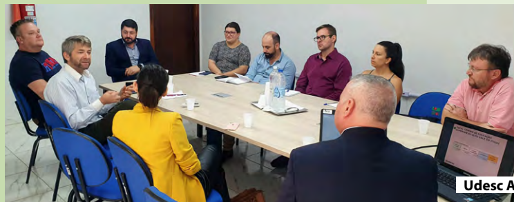
Udesc Alto Vale