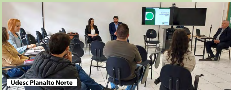
Udesc Planalto Norte