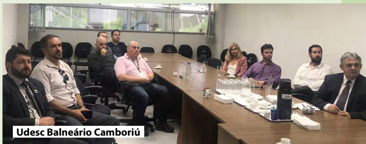
Udesc Balneário Camboriú