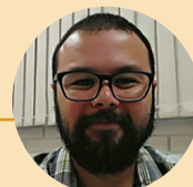
POR GUSTAVO KOGURE

Uma divindade resolverá o problema criado por você. Quem sabe. Em terra de cego, quem tem um olho é rei. Aproveitemos. Irônico! Novo ano se aproxima. Prepare a lista. Control c, control v. Mais fácil. A solução dos resíduos vai muito além daquilo que eu idealizava. É estrutural. E você? Qual filho deixará para recuperar nosso país? Recuse, reduza, reutilize e, se tudo der errado, recicle! Você também é parte do problema e de sua solução. Envie sugestões para gustavo.kogure@udesc.br e acesse www.udesc.br/sustentavel .