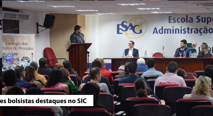
Premiação dos estudantes bolsistas destaques no SIC