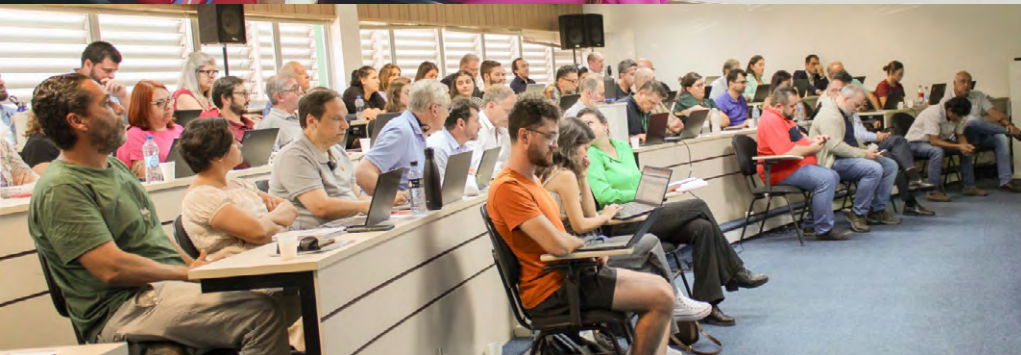
Estão disponíveis os resumos com as decisões votadas pelo Plenário, pela CEG e pela CAP do Consuni em sessões realizadas em março. [LEIA+]