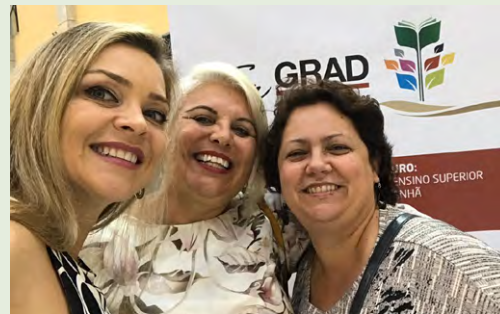
Soraia e representantes da Udesc participaram do 32º Fórum Nacional de Pró-Reitores de Graduação (Forgrad), realizado na Capital.

Tomasi visitou o Morro das Fumças no dia 7 e participou de reuniões com o prefeito, Noi Coral, e representantes do município, além de visitar escolas e empresas.