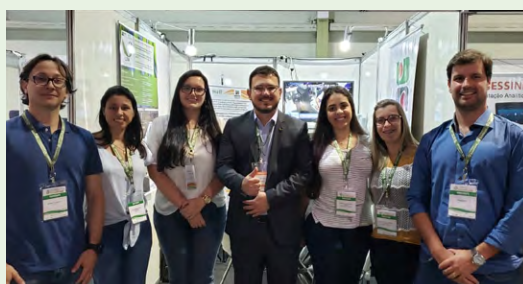
Docentes e alunos participaram do 7º Congresso da Rede Brasileira de Tecnologia e Inovação de Biodiesel, na Capital. Oito trabalhos feitos na Udesc foram apresentados na categoria "Pôster".