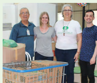
Campanha da Semana do Perdão da Biblioteca Central arrecadou 100 kg de alimentos para a Associação Amigos do HU.