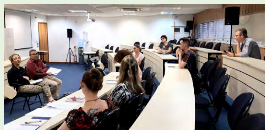
O Conselho do Portal de Periódicos da Udesc realizou sua primeira reunião em novembro