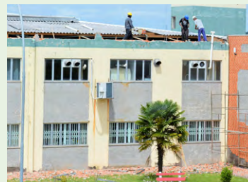
Udesc Lages investe mais de R$ 4 milhões em infraestrutura