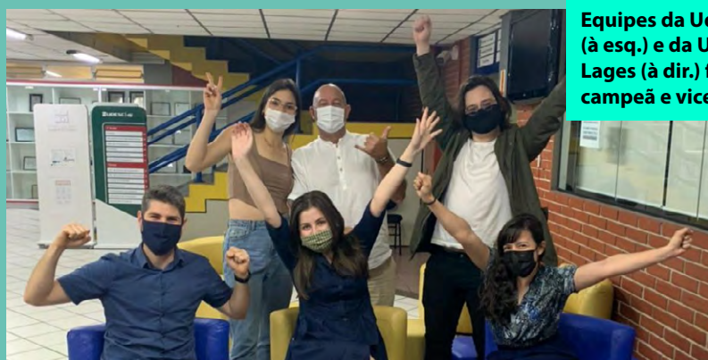
Equipes da Udesc Esag (à esq.) e da Udesc Lages (à dir.) foram campeã e vice em 2021

Na primeira edição, em 2021, a Udesc conquistou o prêmio com resultados expressivos: seis das 48 equipes participantes eram da universidade estadual; cinco chegaram à fase final; e dois dos três primeiros colocados foram da Udesc. A grande campeã foi a Silix Catarina, formada por estudantes de Administração Pública da Udesc Esag. Eles desenvolveram uma plataforma digital e aplicativo móvel voltada para a fidelização de doadores de sangue e melhor segurança e disponibilidade dos estoques dos hemocentros. A vice-campeã foi a equipe Cavtech Biogástech, da Udesc Lages, que desenvolveu um equipamento tecnológico para destinar o lixo orgânico produzido pelas pessoas, transformando-o em energia elétrica, gás ou adubo orgânico. Também participaram a equipe Base CAV, da Udesc Lages; a i9 CCT e a Multi CCT, da Udesc Joinville; e a Acadêmicos da Pandemia, da Udesc Esag. [LEIA+]