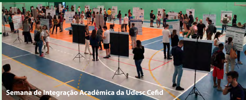
Semana de Integração Acadêmica da Udesc Cefid

◆ A 28ª edição do Seminário de Iniciação Científica (SIC) da Udesc foi realizada ao longo deste mês nos centros de ensino. Em algumas unidades, as apresentações integraram a programação de eventos mais amplos e já tradicionais. Ao todo, participaram do SIC cerca de 600 alunos de graduação e de ensino médio, bolsistas e voluntários, além de professores, técnicos e demais interessados. Os anais da edição 2018 já estão disponíveis no site.