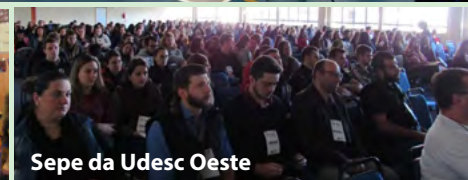
Sepe da Udesc Oeste