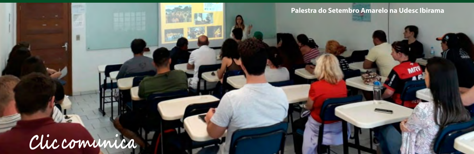
Palestra do Setembro Amarelo na Udesc Ibirama