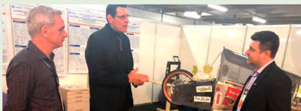
Zvirtes visitou o Congresso Nacional de Inovação e Tecnologia (Inova 2018), realizado pela Udesc Planalto Norte em São Bento do Sul, entre 18 e 20 de setembro.