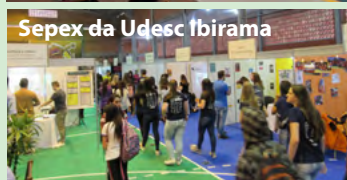
Sepex da Udesc Ibirama