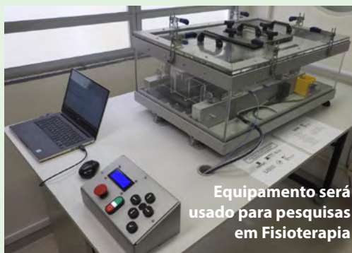
Equipamento será usado para pesquisas em Fisioterapia

◆ Uma parceria entre a Udesc Cefid, o Ifsc e a Fapesc criou um novo equipamento, sem similar no mercado, para uso em pesquisas na área de Fisioterapia. O aparelho – uma esteira automatizada aliada a uma câmara hiperbárica para testes ergométricos em camundongos – foi entregue no dia 8. [LEIA+]