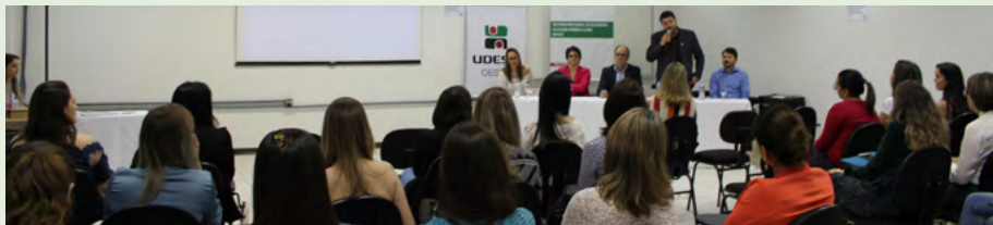
O reitor, Marcus Tomasi, prestigiou a aula magna do Mestrado Profissional em Enfermagem na Atenção Primária à Saúde, realizada no dia 4, na Udesc Oeste.

O Gestão em Movimento apresenta momentos importantes da universidade, representados pela sua equipe de gestão, por meio de fotos. O objetivo é contribuir com a transparência, assim como prestar contas das atividades mais relevantes.